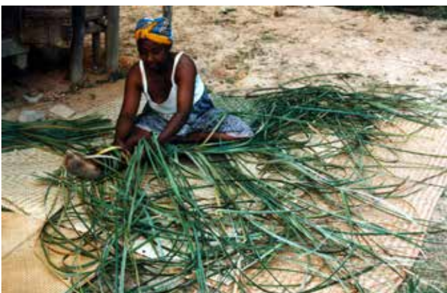
Los bosques y árboles proveen bienes a las comunidades locales que enfrentan amenazas climáticas

Una diferencia entre hacer frente y adaptarse radica en la acción anticipatoria como por ejemplo, el manejo o la restauración de los bosques para garantizar el suministro futuro de productos. En este contexto, la gobernanza es clave para entender por qué algunos ecosistemas son utilizados como herramientas de protección, sin mucha inversión en el manejo, y otros son manejados para asegurar medios de vida sostenibles y resilientes. Los derechos de propiedad y acceso bien definidos son componentes críticos de los sistemas de manejo locales. 39,40 Los derechos de propiedad colectiva o individual ofrecen incentivos para mantener las reservas de recursos a través del tiempo y reducir la vulnerabilidad de las personas que dependen de ellas. 41 Muchos autores han demostrado los