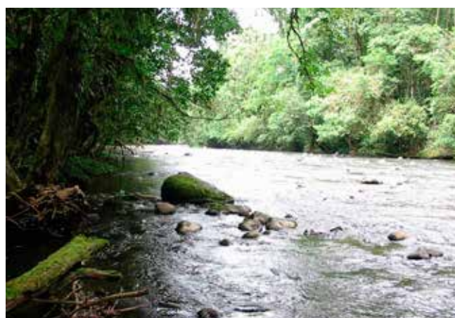
Las cuencas hidrográficas boscosas regulan el agua y protegen los suelos reduciendo los impactos climáticos

Un proyecto de regeneración y plantación forestal en Bolivia ha mostrado una reducción en la vulnerabilidad a la lluvia irregular y a tormentas intensas de las comunidades de Khuluyo. 21 Las comunidades locales dependen de la irrigación para la agricultura además de que las tormentas frecuentes causan la erosión del suelo y deslizamientos de tierra. El fomento de la regeneración natural de los bosques ha mejorado el suministro