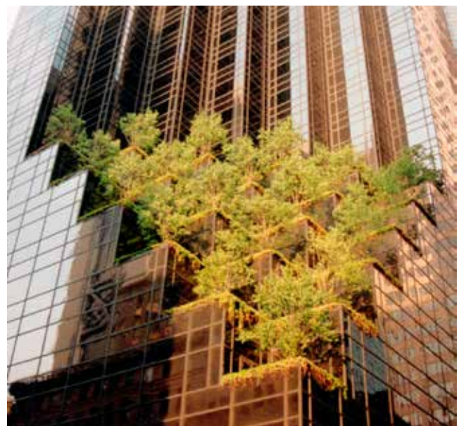
Los bosques urbanos y árboles regulan la temperatura y el agua para ciudades resilientes

La cobertura vegetal parece influir fuertemente en las temperaturas superficiales en Manchester, Reino Unido. La temperatura máxima de la superficie en los bosques urbanos es de 18,4 °C, mientras que en los centros urbanos con la menor cobertura arbórea es de 31,2 °C. Una adición de un 10 % de cobertura vegetal en los centros urbanos podría reducir las temperaturas superficiales máximas en 2,2 °C. Las proyecciones indican para la década de 2080 un aumento en las temperaturas superficiales máximas de 1,5 – 3,2 °C en los bosques, y de 2 – 4,3 °C en el centro de las ciudades, dependiendo del escenario de las emisiones. 105