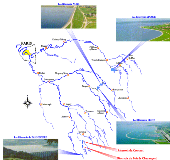
Figure 1 : Le bassin versant de la Seine et les quatre barrages-réservoirs (Marne, Aube, Seine, Pannecièrè)