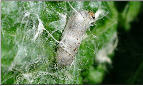
Fig. 2.2. Cocon d'Ichneumonidae