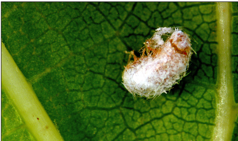
Fig. 2.4. Momie d'Heliococcus bohemicus avec un orifice de sortie partiellement terminé