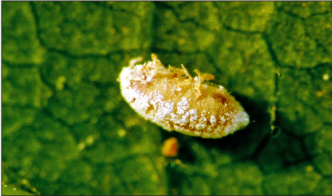
Fig. 2.3. Momie de Phenacoccus aceris