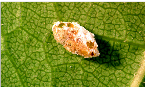
Fig. 2.5. Momie de Phenacoccus aceris avec plusieurs orifices de sortie