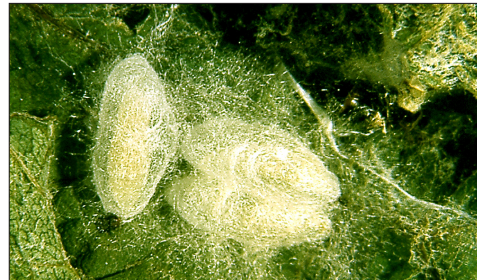
Fig. 2.6. Cocons de Goniozus claripennis

L'action du parasitoïde modifie la physiologie et l'aspect de l'hôte. Il arrive souvent que le développement larvaire de ce dernier soit allongé pour laisser au parasitoïde le temps de parfaire son développement. À la fin de celui-ci, l'hôte se gonfle et devient momifié (fig. 2.3), ou les larves du parasitoïde, c'est le cas chez les Ichneumonoidea et les Bethyliidae, tissent un cocon qui constitue un abri pour la nymphose (fig. 2.2 et fig. 2.6). Dans ce dernier cas, les larves endoparasitoïdes ressortent donc de l'hôte s'il n'est pas complètement desséché. La sortie des adultes de Chalcidoidea ou de tout autre parasitoïde ne tissant pas de cocon est marquée par l'apparition d'un orifice circulaire (fig. 2.4, 2.5 et 2.7) qui constitue donc une trace du parasitisme. On peut par exemple l'utiliser pour évaluer le taux de parasitisme d'un oophage (cas des trichogrammes, parasites oophages des tordeuses).