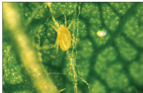
Fig. 2.119. Tydeidae forme estivale