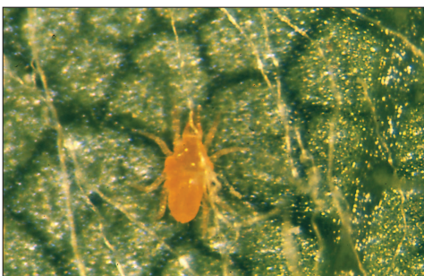
Fig. 2.117. Bdellidae