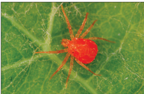
Fig. 2.116. Anystis sp.