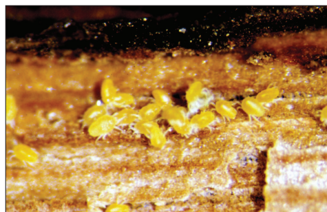
Fig. 2.120. Tydeidae, formes hivernantes