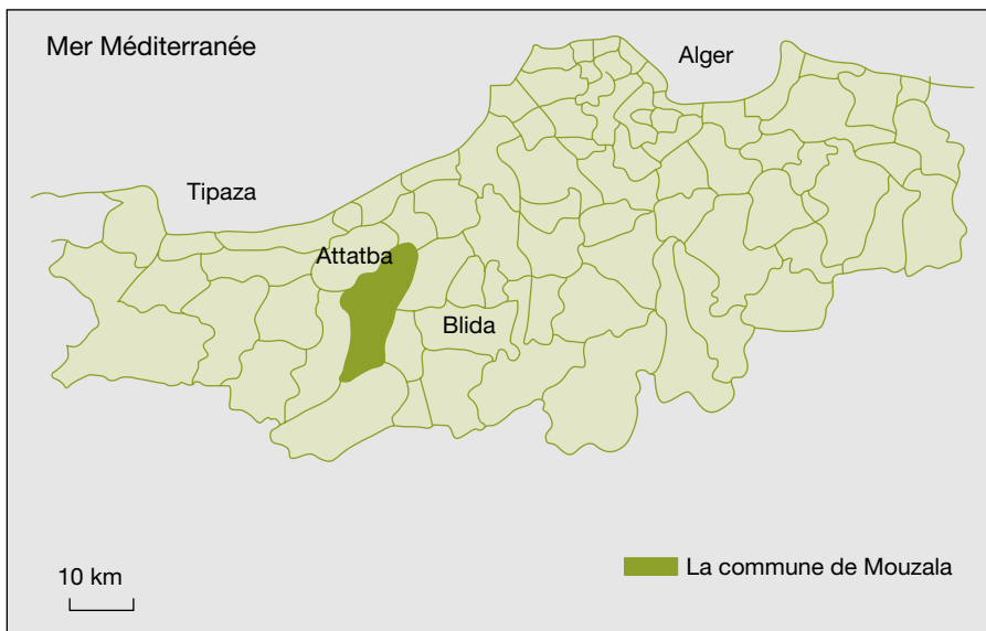
Figure 1. La position géographique de Mouzaïa (zone d'étude).

La typologie de comportement des agriculteurs enquêtés dans les EAC de l'ex-DAS Boudjema Ikhlef a été établie sur la base des critères déterminant le partage du foncier et les arrangements informels entre attributaires et preneurs : réalisation d'investissements