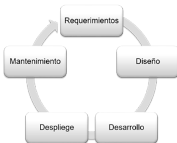
FIGURA 2. Fases de desarrollo en la metodología iterativa e incremental. Autores

Para este trabajo el modelo de proceso más conveniente, es un proceso iterativo e incremental (Figura 2), debido a que permitió obtener diferentes versiones del producto software antes de su finalización y entrega, además de la progresiva depuración y validación del mismo, lo que sin duda dió como resultado un software más adaptable para los usuarios (García Peñalvo, 2020).