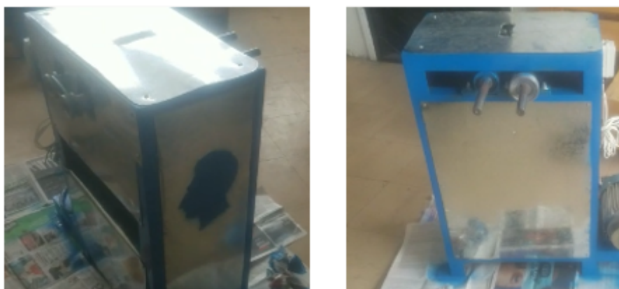
FIG. 3 Máquina Desfibradora