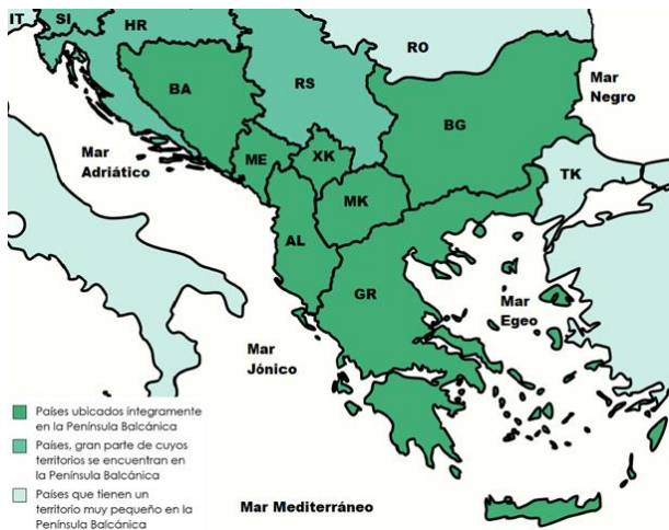
Figura 1. Países de la Península Balcánica