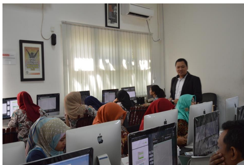
Gambar 3. Pemberian Materi