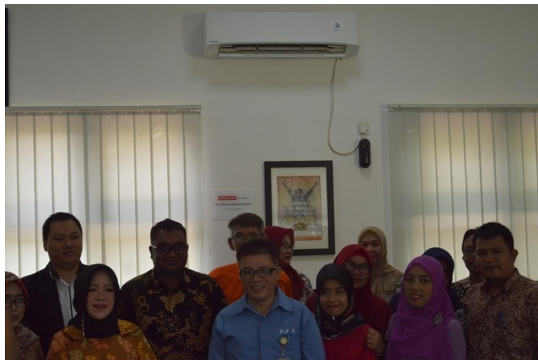
Gambar 2. Tim pelaksana PKM