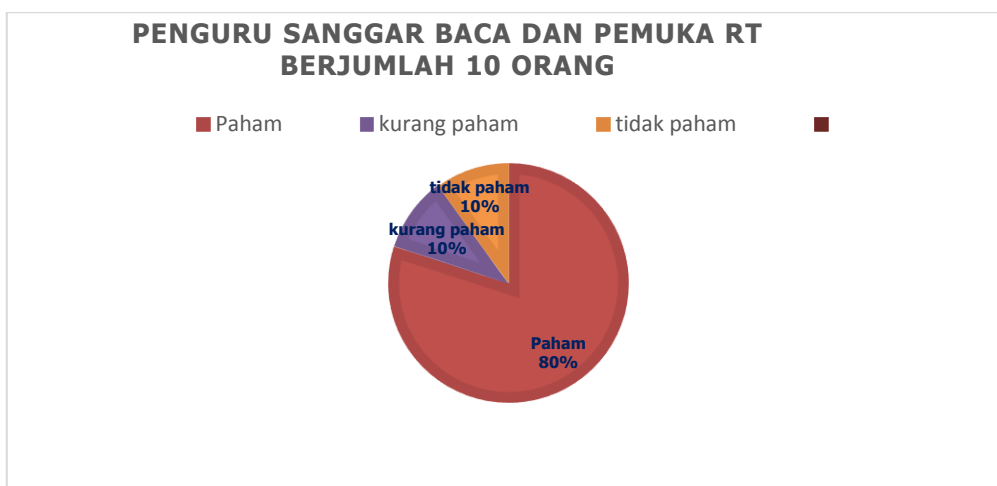
Gambar 4. grafik tingkat pemahaman lokakarya sistem publikasi berbasis internet.

dalam kegiatan ini diikuti oleh pengurus dan pemuka masyarakat. Karena tujuan dari kegiatan lokakarya ini adalah agar pengurus dan pemuka masyarakat dapat menulis artikel yang dapat di unggah ke dalam web yang dimiliki oleh Rt. Banyak sekali permasalahan karena dari pengurus dan pemuka masyarakat mayoritas masih muda dan belum paham benar dengan pembuatan artikel. Melalui sistem lokakarya, teknis implementasi dikerjakan di rumah masing-masing, dengan menerapkan teknis penulisan yang dapat dipublikasikan di web Rt secara tepat.