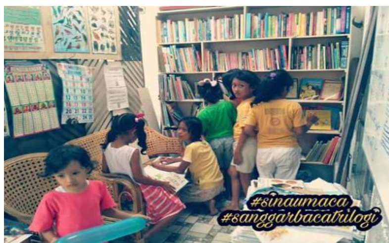
Gambar 1. Sanggar Baca Trilogi

Tempat bacaan yang baik memiliki desain yang sangat multiliterasi, hal ini dibuktikan dalam menjawab tututan zaman dan tantangan pendidikan. Menurut Yunus abiding (2015) "konsep multi literasi yaitu multi konteks, multi media dan multi budaya". Taman bacaan masyarakat saat ini sangat populer dibandingkan dengan perpustakaan yang ada disekolah, sanggar baca yang ada dimasyarakat umum memiliki daya tarik tersendiri dikarenakan dibarengi rasa senang akan kebebasan jam diluar sekolah yang memiliki peraturan tidak mengikat. Perpustakaan sekolah memiliki konsep dan sistem yang baku, sementara untuk taman baca bersifat tidak baku, hal ini juga berfungsi untuk melestarikan masyarakat, meningkatkan kualitas masyarakat itu sendiri dan juga menekankan hubungan kehidupan sosial, politik dan ekonomi masyarakat (Wina sanjaya,2006).