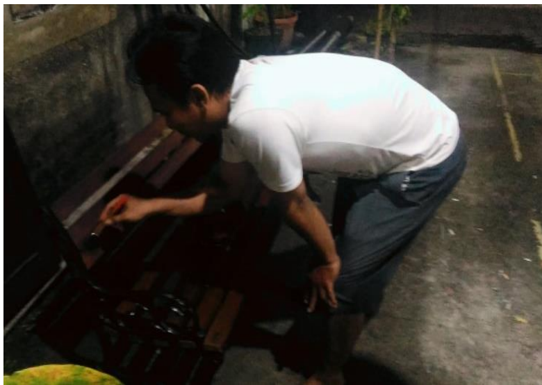
Gambar 5. Pengerjaan modifikasi sarana dan prasarana pendukung kegiatan belajar dan bermain

Penerapan implementasi ini merupakan kegiatan yang paling membutuhkan waktu dan diskusi secara sederhana. Teknis pelaksanaan ini bertempat di area diskusi Rumah makan Janti Klaten. Dimana dihasilkan secara musyawarah bahwa banyak anak sangat minim sekali fasilitas umum yang dapat digunakan untuk area belajar dan membaca buku khususnya. Sehingga hasil dari musyawarah ini diteruskan dalam wujud FGD ( focus group discussion ) antara pelaksana pengabdian masyarakat, pemuka Rt dan pengurus sanggar baca.