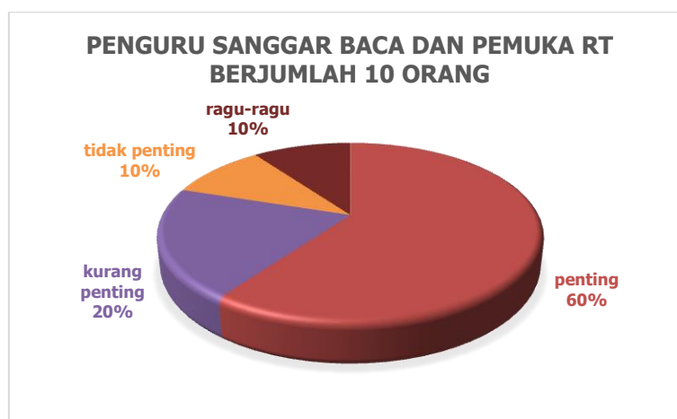
Gambar 6. Grafik prosentase modifikasi tempat belajar dan bermain

Karena minimnya fasilitas utamanya tempat duduk maka perlu adanya modifikasi tempat duduk yang menarik, nyaman dan anak khususnya sebagai pengguna lebih senang dalam menempatinnya. Maka dipilihlah modifikasi kursi taman yang diletakkan pada fasilitas umum untuk menunjang proses belajar dan membaca masyarakat umum.