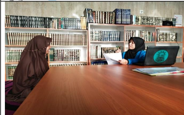
المقابلة مع المدبرة