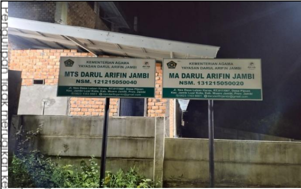
أمام مباني معهد دار العارفين

2. Dilarang memperbanyak sebagian dan atau seluruh karya tulis ini dalam bentuk apapun tanpa izin UIN Sunta Jambi