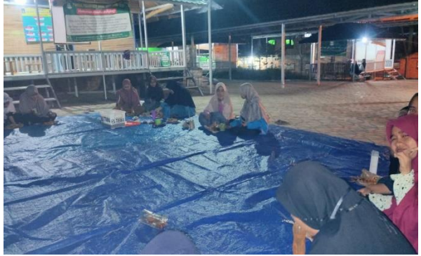
المقابلة مع الاستاذة