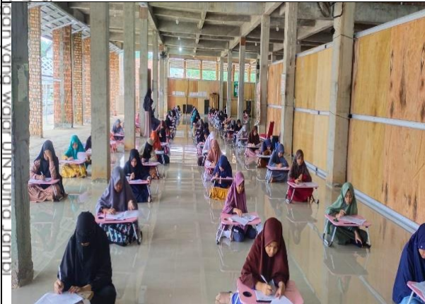
التدريبات كل شهر في مهارة الكتابة