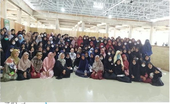
التوجيهات من قسم اللغة