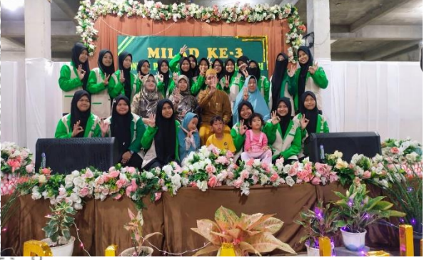
البرنامج الإفتتاحية يوم الميلااد لمسابقة من قسم اللغة