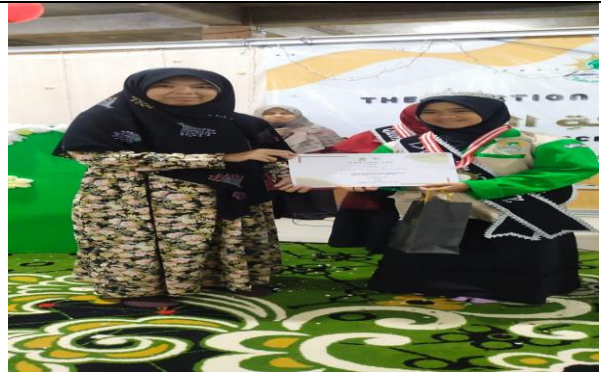
المسابقة و الهدية للتلميذة