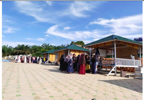
عند إلقاء المفردات كل صباح