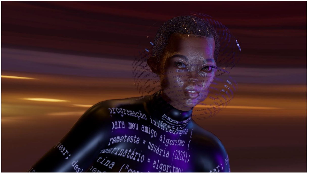
Figura 1: Still de @Ilusão (2020).