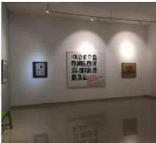
Gambar 5. Pencahayaan Galeri Nasional.

Pencahayaan yang digunakan di dalam Galeri Nasional Indonesia berupa pencahayaan rekaan dengan menggunakan lampu LED sorot untuk pajangannya. Dilakukannya hal tersebut untuk mengurangi intensitas pencahayaan terhadap karya seni yang ada di dalam galeri (Chiara, J. D. Chiara, 1973).