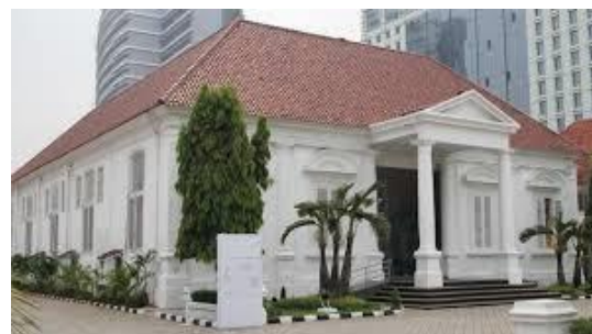
Gambar 3. Entrance Galeri Nasional.

Entrance pada Galeri Nasional Indonesia diakses secara langsung, namun mempunyai penghubung pada ketinggian lantainya. Agar memudahkan pengunjung untuk naik ke elevasi tanah ke elevasi lantai bangunan.