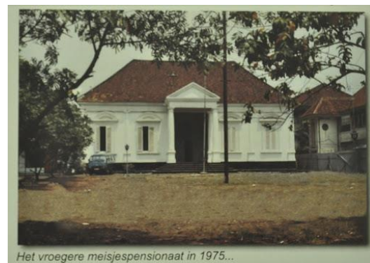
Het vroegere meisjespensionaat in 1975...

Pada tahun 1955, Pemerintah Republik Indonesia melarang kegiatan pemerintah dan masyarakat Belanda. Pembangunan dan pengelolaan usaha pendidikan dialihkan ke Yayasan Raden Saleh yang masih penerus CAS dan masih di bawah gerakan Vrijmetselaren Lorge. Berdasarkan keputusan Presiden Soekarno tahun 1962, gerakan Vrijmetselaren Lorge dilarang dan Yayasan Raden Saleh dibubarkan. Sekolah dan semua perlengkapannya diambil alih oleh pemerintah Republik Indonesia dan dipindahkan ke Kementerian Pendidikan dan Kebudayaan.