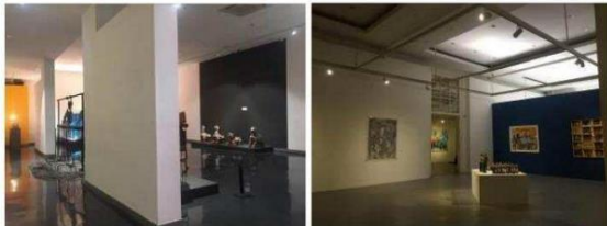
Gambar 4. Ruang Sirkulasi Galeri Nasional.

Sirkulasi pada bangunan Galeri Nasional Indonesia baik dan terarah serta sesuai dengan syarat sirkulasi galeri secara umum.