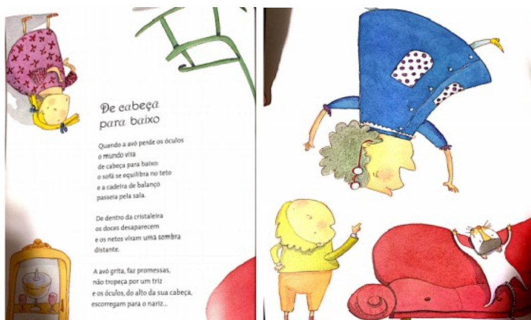
Figura 2 - Poema De cabeça para baixo.

Vale considerar que a autora e a ilustradora retratam vivências de uma avó, cujas características se enquadram no padrão de classe média, se distanciando da maioria das avós das crianças que frequentam as instituições públicas, o que pode ser percebido nos cenários e objetos que envolvem o cotidiano retratado nos poemas. Entretanto, sabemos que todas as crianças têm avós, ou já tiveram, e o que importa são as relações afetuosas que são estabelecidas nas vivências junto a elas, independente das condições sócio econômicas e culturais que possuam. Para a análise e sugestões de vivências brincantes, escolhemos “De cabeça para baixo”, um poema que nos chamou a atenção dentre os demais, devido ao humor suscitado tanto nas ilustrações quanto no texto verbal.