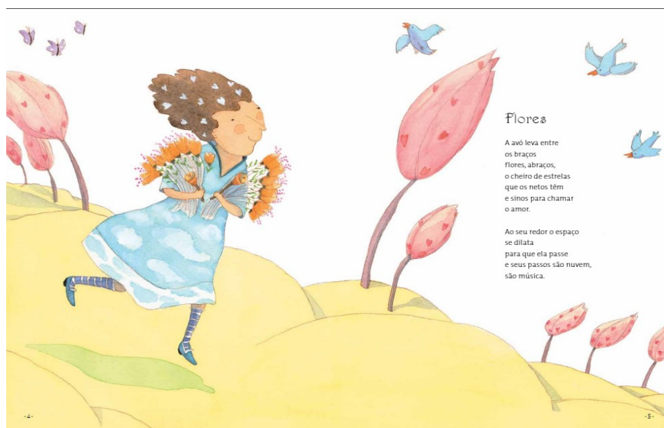
Figura 2 - Poema Flores.

O miolo do livro apresenta momentos diversos: a avó se prepara para receber seus netos e aproveita para colher flores e deixar o ambiente cheiroso e bonito. Para deixar a casa mais animada e cheia de surpresas, necessita mudar os objetos de lugar dando espaço para os vários cenários em que a casa irá se transformar, a exemplo do salão de beleza, salão de danças, o circo e até fundo do mar. Com criatividade costura em sua máquina vestidos rendados, sol, lua e assim vai montando as fantasias que serão usadas durante as aventuras. Sua bengala transforma-se em vara de condão para atender os mais variados desejos dos netos. Também os envolve nos cuidados com a casa e com as plantas. É nesse cotidiano afetivo e lúdico que os poemas vão se desvelando ao longo do livro, vejamos nos exemplos das figuras 2 e 3: