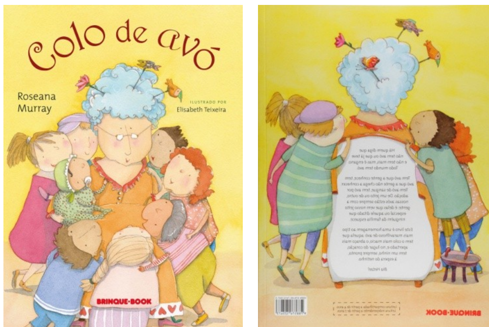
Figura 1 - Capa e quarta capa de Colo de avó

O livro Colo de avó , de Roseana Murray, com ilustrações de Elisabeth Teixeira, foi lançado pela editora Brinque-Book, em 2017 e é endereçado ao público infantojuvenil conforme indicado em sua publicação. É composto por 16 poemas que versam sobre o tema avó. O livro é permeado pela brincadeira, ou seja, possui um caráter lúdico que aparece em cada verso e estrofe. Nele, Roseana Murray, revivendo talvez, o seu lugar de neta ou de avó, viaja em sua imaginação, abrindo as portas da fantasia e da criação, brincando com o jogo de palavras, rimas e metáforas, fazendo majoritariamente uso da linguagem poética conotativa. A obra desvela um conjunto de experiências que se dão no dia a dia na casa de uma avó, sob um olhar singelo e afetoso de como as relações com os netos são construídas. Com muita sensibilidade ela convida o leitor a adentrar na brincadeira, na magia do faz de conta e vivenciar com prazer, diversão e muito amor o ser avó e estar com os netos.