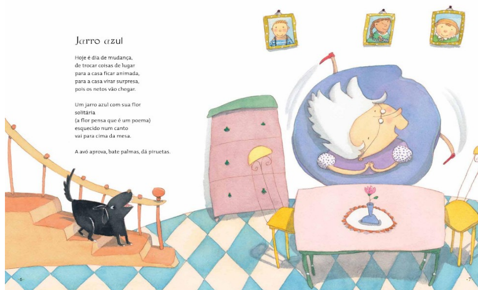
Figura 2 - Poema Jarro azul.

Vale considerar que a autora e a ilustradora retratam vivências de uma avó, cujas características se enquadram no padrão de classe média, se distanciando da maioria das avós das crianças que frequentam as instituições públicas, o que pode ser percebido nos cenários e objetos que envolvem o cotidiano retratado nos poemas. Entretanto, sabemos que todas as crianças têm avós, ou já tiveram, e o que importa são as relações afetuosas que são estabelecidas nas vivências junto a elas, independente das condições sócio econômicas e culturais que possuam. Para a análise e sugestões de vivências brincantes, escolhemos “De cabeça para baixo”, um poema que nos chamou a atenção dentre os demais, devido ao humor suscitado tanto nas ilustrações quanto no texto verbal.