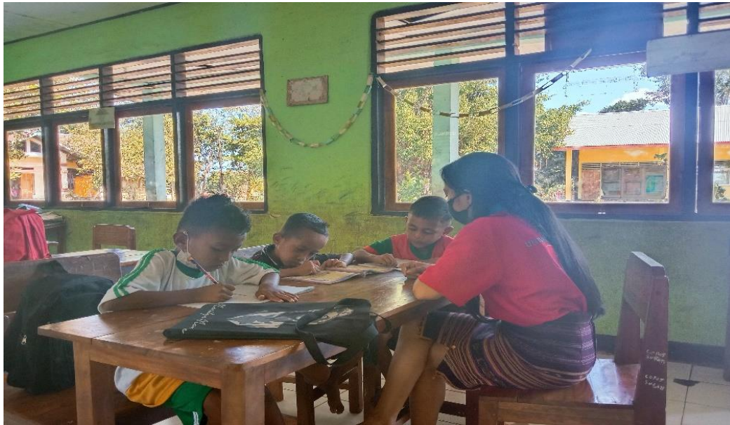
Gambar 2. Bimbingan Belajar siswa Menulis huruf abjad A-Z, Menulis Angka 1-50, Membaca/Mengeja kata perkata dibuku paket

Selain menuliskan dipapan tulis, siswa juga di bimbing untuk menuliskan didalam buku tulis mereka masing-masing agar lebih dipahamai, diingat dan lancar dalam menulis, menyebutkan serta mengeja, membaca baik dibuku paket yang disiapkan disekolah maupun catatan yang diberikan oleh guru. Selain kegiatan bimbingan belajar yang dilakukan di sekolah, kegiatan bimbingan akan dilanjutkan dirumah.