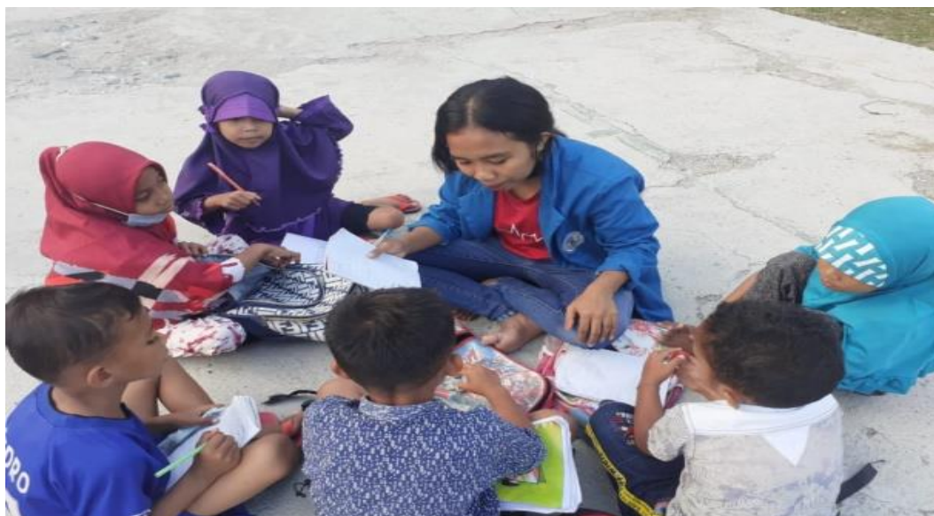
Gambar 4. Bimbingan belajar anak SD dirumah dengan melatih anak menulis dan membaca satu per satu

Berdasarkan gambar di atas dapat dijelaskan bahwa kegiatan bimbingan yang dilakukan dirumah itu dimaksudkan mengulang kembali kegiatan yang sudah dilakukan disekolah, dengan cara melatih membaca huruf dari A-Z, melatih menulis huruf A-Z, melatih menulis angka, menjumlahkan angka kecil dengan menghitung menggunakan jari tangan, agar siswa dibiasakan dan mereka dapat mengingatnya.