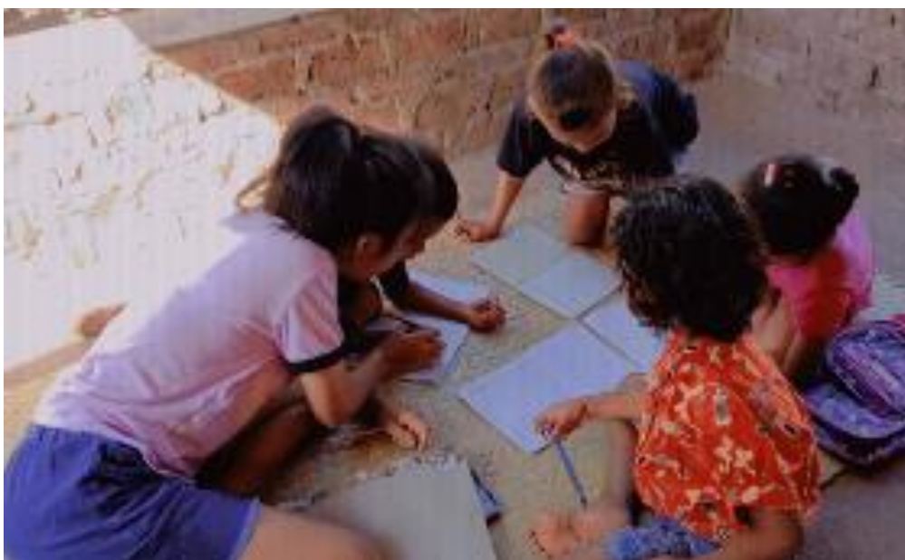
Gambar 3. Bimbingan Belajar Anak SD dirumah dengan menggunakan kalender huruf abjad, dan melatih menulis di buku tulis

Kegiatan bimbingan dirumah berupa 1) membimbing siswa mengenal, menulis dan menyebut satu per satu huruf abjad di kalender huruf, 2) melatih siswa yang belum bisa menulis dengan memegang tangan mereka, 3) menyusun huruf A-Z dengan menggunakan kartu huruf (Meke, Wondo & Wutsqa, 2020), 4) melatih menghitung penjumlahan dan pengurangan angka kecil dengan menggunakan jari tangan, 5) menyebut huruf abjad A-Z dengan mengangkat , menghitung penjumlahan dan pengurangan angka kecil dengan memperagakan jari tangan.