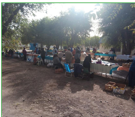
Figura 2: Artesanos y productores comercializando.