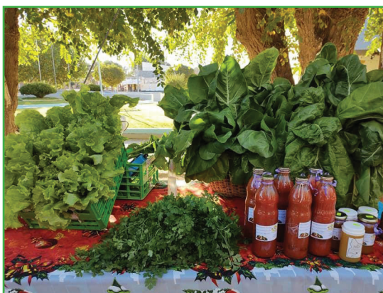
Figura 3: Comercialización de hortalizas y productos elaborados.