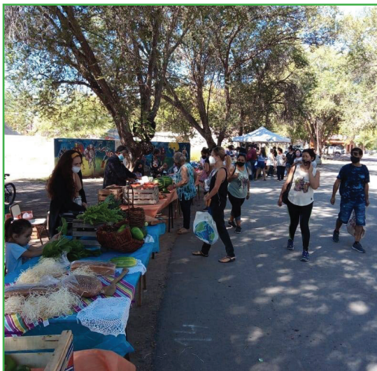
Figura 1: Día de feria en Picún Leufú.