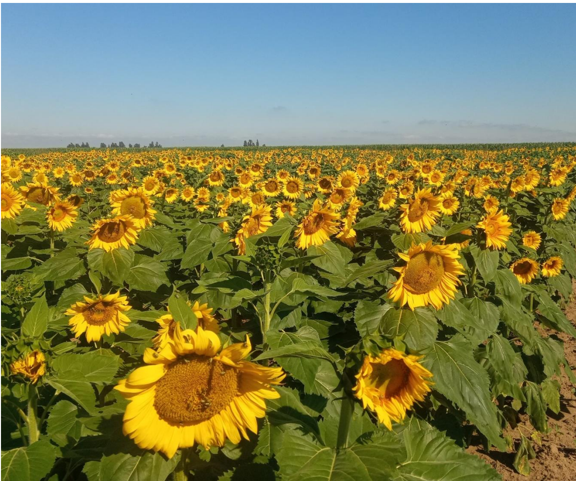
Imagen 1. Ensayo RET 20/21 en la EEA INTA Manfredi.