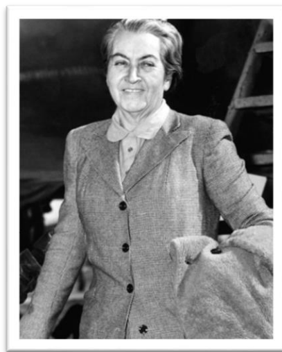
Imagen 11. Fotografía de Gabriela Mistral