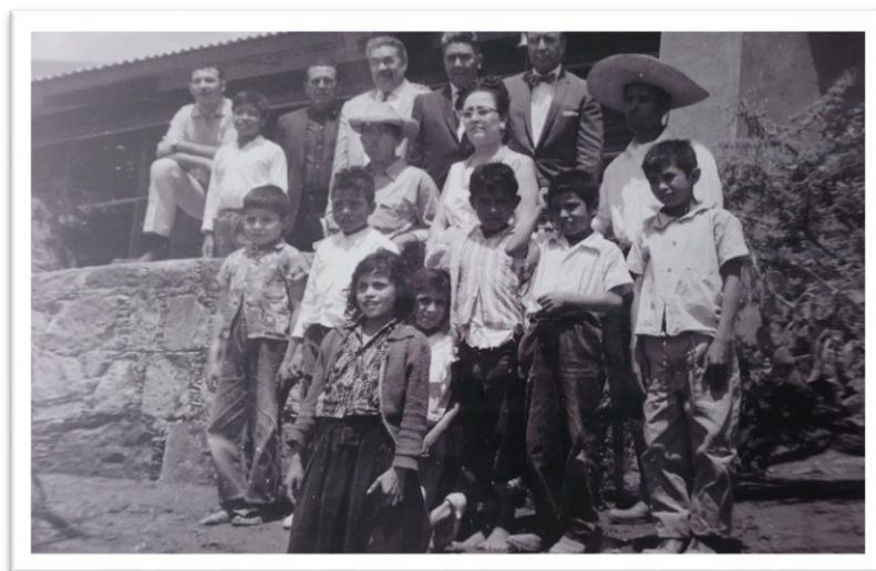
Imagen 4. Fotografía de maestra y autoridades escolares con alumnos y alumnas