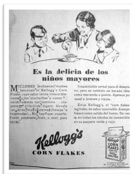
Imagen 5. Anuncio Kelloggs, periódico El Universal, 1938

A pesar de estos cambios, a la mayoría de las mujeres, sus “deberes” en el hogar las anclaban a un estilo de vida que la sociedad les marcaba, además, de convertirse en un objetivo comercial para las empresas, quienes, mediante la prensa, difundieron sus productos e imágenes relacionadas a las mujeres y la actividad doméstica, conservando así, el estereotipo de mantenerla como “la reina del hogar”.