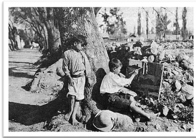
Imagen 1. Fotografía de alumnos de la Escuela de pintura al aire libre de Tlalpan, 1926