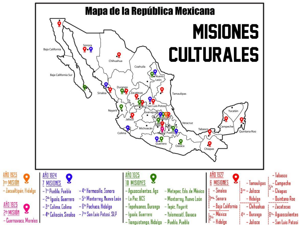
Imagen 3. Mapa general de las misiones culturales en México 1923-1927