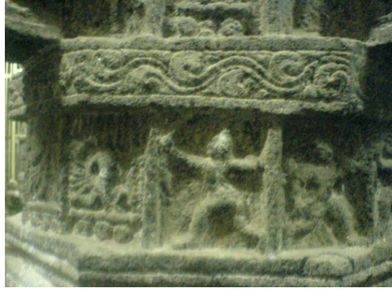
படம் 3. இராம இராவணப்போர்

ஸ்ரீபெரும்புதூர் ஆதிகேசவப்பெருமாள் கோயில் கோபுர வாயிலின் மூன்றாவது வரிசையில் இராவணன் தேரில் நின்றவாறு அம்பு எய்கிறான். எதிரில் அனுமன் வணங்கிய நிலையில் இருக்கிறான். அனுமன் தோளில் இராமன் அமர்ந்து இருக்கிறான். இக்காட்சி அனுமன் வணங்கி தன் மீது அமரும்படி கேட்டுக் கொள்வதையும் இராமனும் இசைந்து அனுமன் மீதிருந்தபடி போரிடுவதையும் காட்டுகிறது. காஞ்சிபுரம் ஏகாம்பரேஸ்வரர் கோயில் உருத்ராட்ச மண்டபத்துணில் இராமன் அம்பு எய்வதும் எதிரில் இராவணன் தூலாயுதத்தை எடுத்துப் போரிடுவதும் காட்சியாக்கப்பட்டுள்ளது. இச்சிற்பம் இராமாயண நிகழ்வினைச் சுட்டி நிற்கிறது படம் 3-யை பார்க்க.