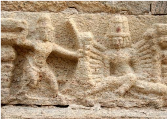
படம் 5. இராவணன் வதைபடம்