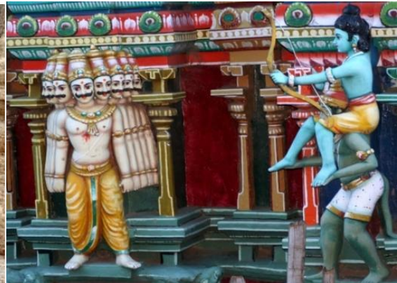
படம் 6. இராம இராவணப்போரும் வதையும்

இராவணன் இறந்த பிறகு இராமனின் ஆணைப்படி விபீடணன் தன் சகோதரனுக்கு இறுதிக்கடன் செய்கிறான். இந்நிகழ்வு கூடலூர் கூடலழகிய பெருமாள் கோயில் சுற்றுச்சுவரில், பத்துத் தலைகளுடன் இராவணன் சிதையில் படுத்திருக்க மண்டோதரி அமர்ந்த நிலையில் தலைவிரித்துப் புலம்புவதும், விபீடணன் நீர்க்குடம் தலையில் வைத்துச் சுற்றி வருவதாகவும் சிற்பம் உள்ளது.