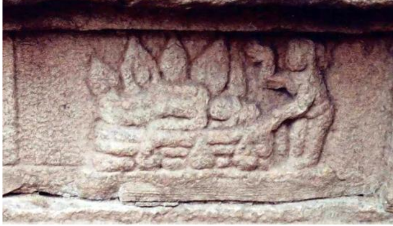
படம் 7. இராவணன் சீதைக்கு விபீடணன் தீ வைத்தல்