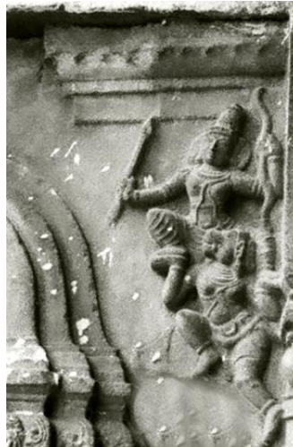
படம் 1. இராமனை அனுமன் தோளில் தூக்கிச் செல்லும் காட்சி

இராவணன், இந்திரஜித்து போரில் இறந்த செய்தி கேட்டு அரற்றிப் புலம்புகிறான். இராவணன் மந்திரிகளுடன் ஆலோசித்து இராம இலக்குவணரை வானர சேனைகளோடு எதிர்கொள்ள, படைத்தளபதி பிரகஸ்தனைப் போரிட அனுப்புகிறான். அவன் போரில் மாண்டதை அறிந்து சீற்றத்துடன் இராவணன் போருக்கு எழுகிறான். இராவணன் இலக்குவணன், சக்கிரீவன், அனுமன் ஆகியோருடன் போரிட்டுக் கடைசியாக இராமனுடனும் போரிட்டுத் தோல்வியைத் தழுவித் தன் இருப்பிடம் சேருகிறான். இந்நிகழ்வாக கோபுரப்பட்டி அவனீஸ்வரமுடையார் கோயில் அதிட்டானத்திலும், காஞ்சிபுரம் வரதராசப்பெருமாள் கோயில் கல்யாண மண்டபத்தின் நான்காவது வரிசை நான்காவது தூணிலும் இரண்டாவதுவரிசை ஐந்தாவது தூணிலும் உள்ளது. இக்காட்சியே ஸ்ரீரங்கம் இரங்கநாதர் கோயில் சேசாங்கிராயர் மண்டபத்தின் மூன்றாவது வரிசை, முதல் தூணில் சங்கு சக்கரங்களுடன் விஷ்ணுவை அனுமன் தோளில் தூக்கிச் செல்லும் காட்சி இருக்கிறது படம் 1-யை பார்க்க.