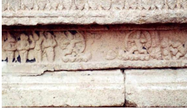
படம் 4. இராம இராவணப்போரும் வதையும்

இராவணனின் துண்டிக்கப்பட்ட தலைகளாக உள்ளன படம் 4-யை பார்க்க. இச்சிற்பம் இராமன் இராவணனின் பத்துத் தலைகளை வீழ்த்திய காட்சியைப் படம் பிடித்துக் காட்டுவது போல உள்ளது. தஞ்சாவூர் கலியுகவெங்கடேசப் பெருமாள் கோயில் கொடிமர மண்டபச் சுவரிலும் போர்க்காட்சி காட்டப்பட்டுள்ளது. இந்நிகழ்வு வால்மீகி இராமாயணம், கம்பராமாயணம் மற்றும் இரங்கநாத இராமாயணங்களில் மாற்றமின்றிக் காணப்படுகின்றது (Srinivasa Iyengar, 1963).