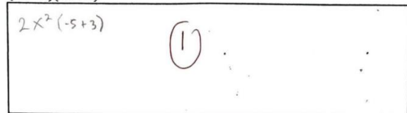
Gambar 2. Hasil jawaban subyek 7 pada nomor 1

Jabarkanlah bentuk perkalian berikut dengan menggunakan hukum distributif: (2x - 5)(2x + 3)