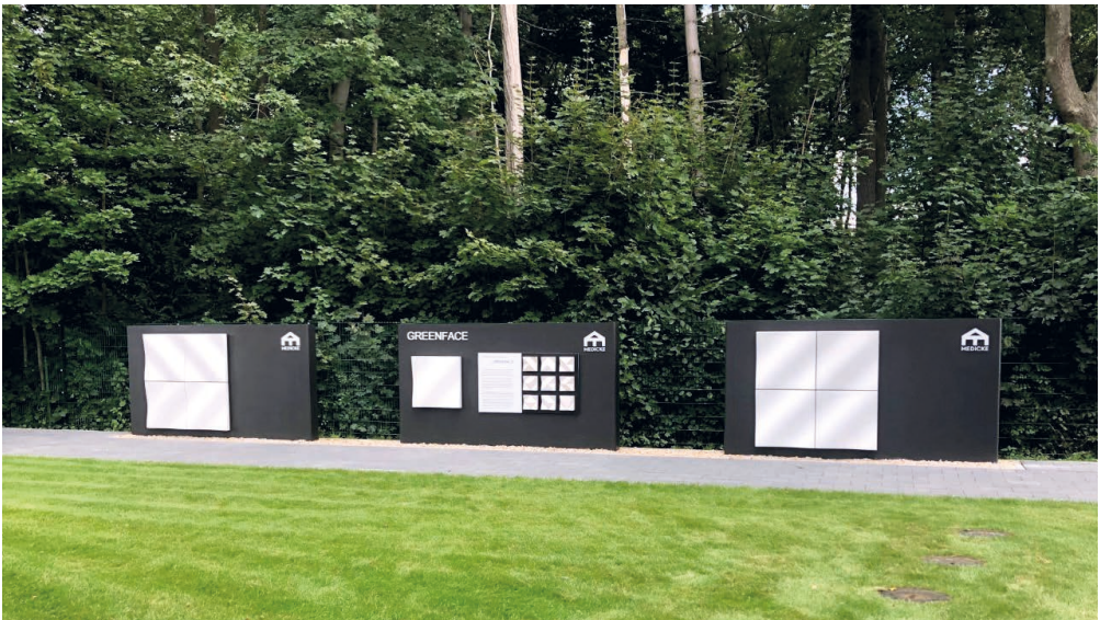
Bild 2: GreenFACE Referenzfassade | Fig. 2: GreenFACE reference façade