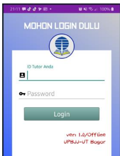
Gambar 1 Tampilan Aplikasi T-21

dikembangkan tim peneliti. Mungkin pemanfaatan aplikasi di blank spot area menjadi salah satu keunikan dari aplikasi ini.