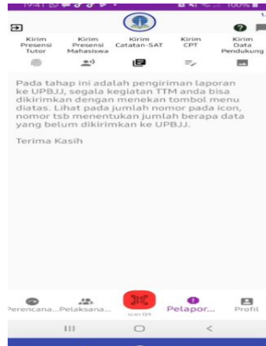
Gambar 5 Pelaporan presensi diri, mahasiswa, Capaian SAT, pengisian CPT