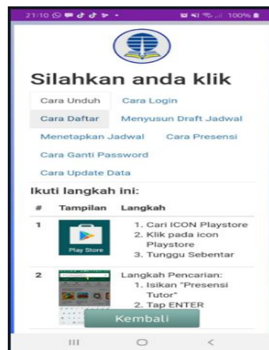
Gambar 7 Panduan Penggunaan T-21