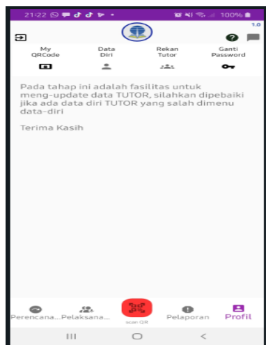
Gambar 6 profil, ganti password, rekan tutor, Scan QR Code, jalur komunikasi UPBJJ