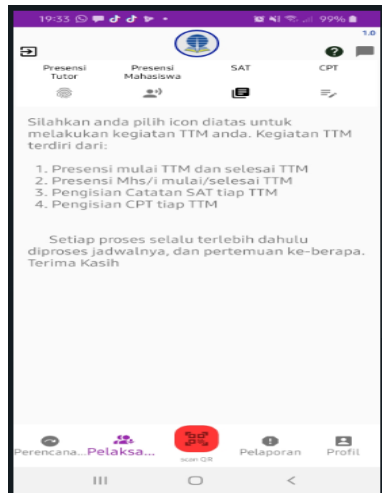
Gambar 4 Pelaksanaan presensi diri, mahasiswa, Capaian SAT