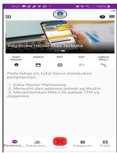
Gambar 2 Master data, Jadwal, RAT SAT