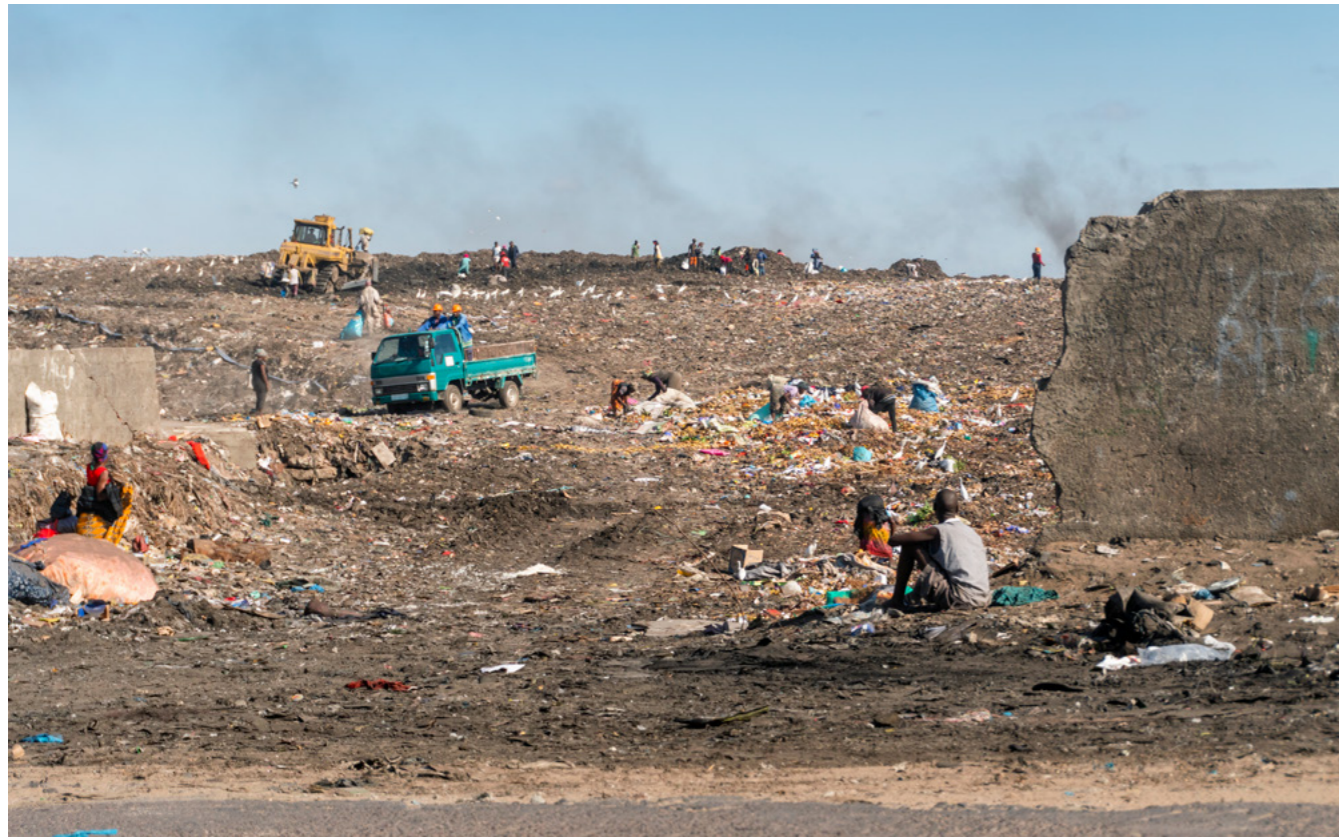
Menschen sammeln Ressourcen von einer riesigen Müllhalde in Maputo, Mosambik

Beide Fälle erfordern, dass das entwicklungspolitische Potential der Kommunalwirtschaft kommunalen und staatlichen Entscheidungsträgern sowie weiteren zentralen Akteuren in der Entwicklungszusammenarbeit bekannt ist. Hier bedarf es nach wie vor weiterer Informationsmaßnahmen, um die kommunalwirtschaftlichen Möglichkeiten in der Entwicklungspolitik nicht nur in den Unternehmen, sondern auch bei weiteren relevanten Stakeholdern bekannter zu machen.