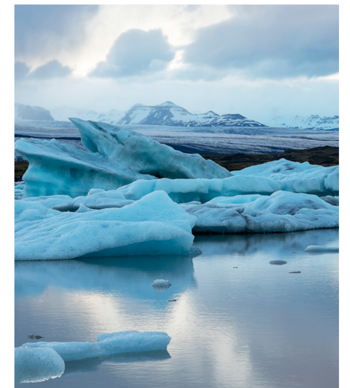
Die Folgen des weltweiten Klimawandels sind vor allem in der Arktis deutlich zu erkennen.

Bei der Anpassung an den globalen Klimawandel sowie bei der Förderung einer weltweiten klimaverträglichen Entwicklung kommt dem Globalen Süden eine besondere Bedeutung zu. Einerseits, weil das dortige Bevölkerungswachstum in Zukunft zu einem enormen Mehrbedarf an Fläche, Energie, Wasser und Lebensmitteln führen wird. Andererseits bieten viele Schwellen- und Entwicklungsländer optimale Voraussetzungen für den Aufbau und den Betrieb einer nachhaltigen Industrie und Infrastruktur sowie einer umwelt- und klimaverträglichen Energieversorgung. Diese und weitere Punkte verdeutlichen eindrucksvoll das Potential der entwicklungspolitischen Zusammenarbeit mit Ländern und Akteuren des Globalen Südens bei der Bekämpfung des weltweiten Klimawandels.