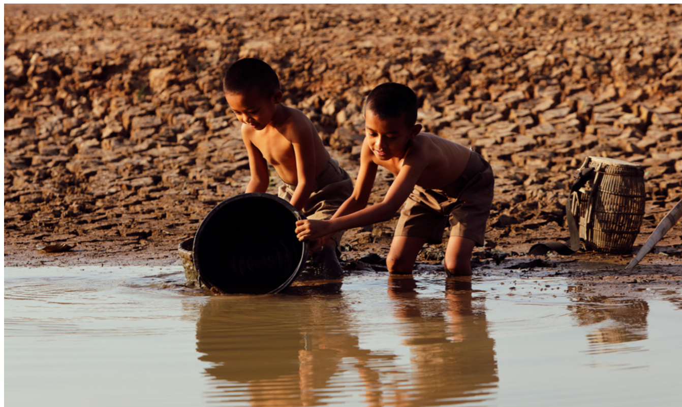
Eine mangelhafte Wasserversorgung führt zu zahlreichen Folgeproblemen und verhindert beispielsweise den Zugang zu Bildung für viele Menschen in Entwicklungsländern.