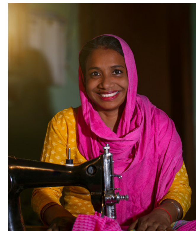
Der Lohnanteil einer Näherin eines Marken T-Shirts liegt gerade einmal bei 0,6 %

Umwelt- und Klimaschutz, nachhaltige Ressourcennutzung, Energiewende, extreme Armut, fairer Welthandel und viele weitere globale Herausforderungen können lokal angegangen werden. Dafür müssen die notwendigen Rahmenbedingungen geschaffen werden und die lokale Ebene in die Lage versetzt werden, soziale und ökonomische Entwicklung zu ermöglichen und bessere Lebensbedingungen auf Basis umweltschonender Lösungen für die Menschen vor Ort zu realisieren.