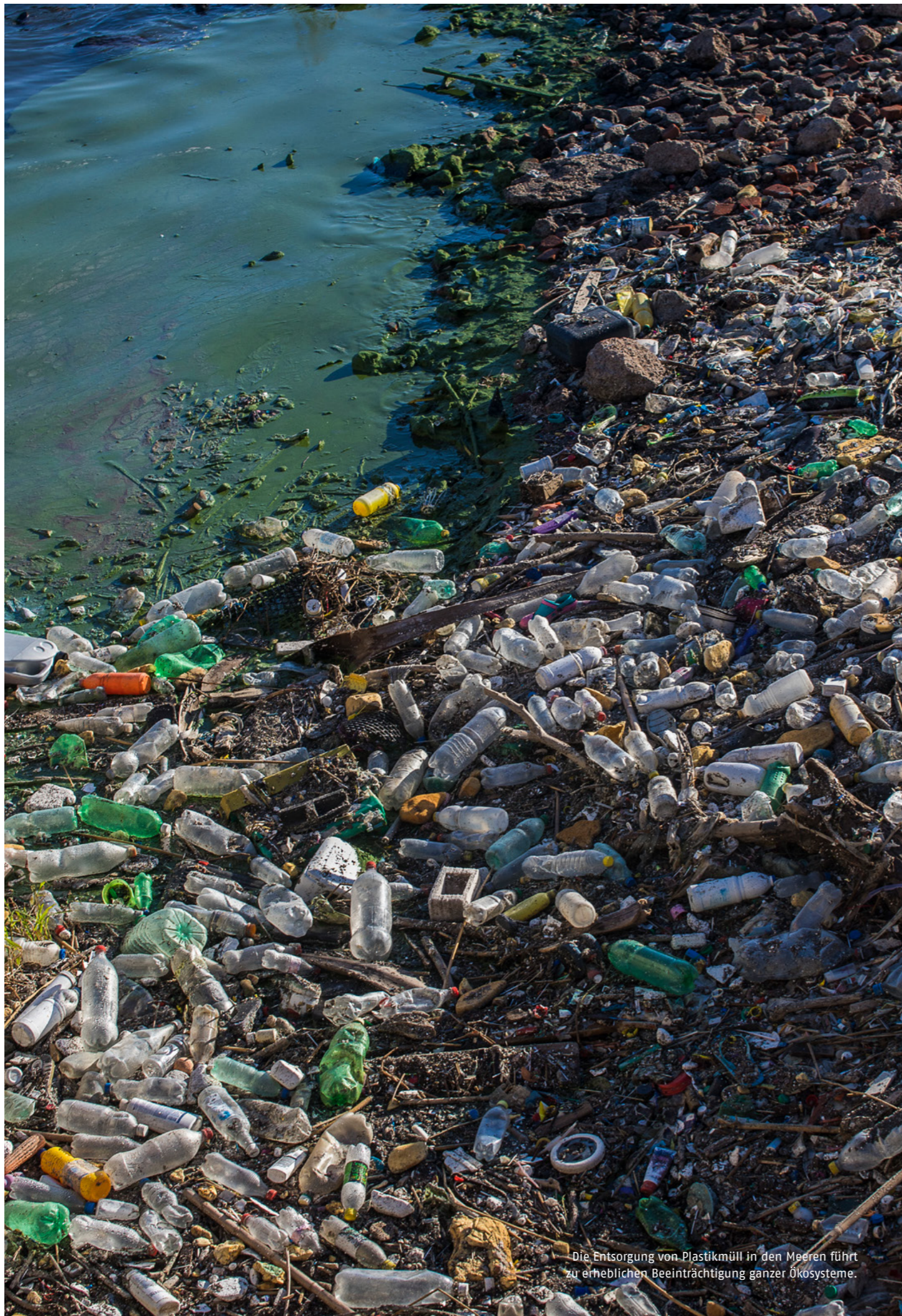
Die Entsorgung von Plastikmüll in den Meeren führt zu erheblichen Beeinträchtigung ganzer Ökosysteme.