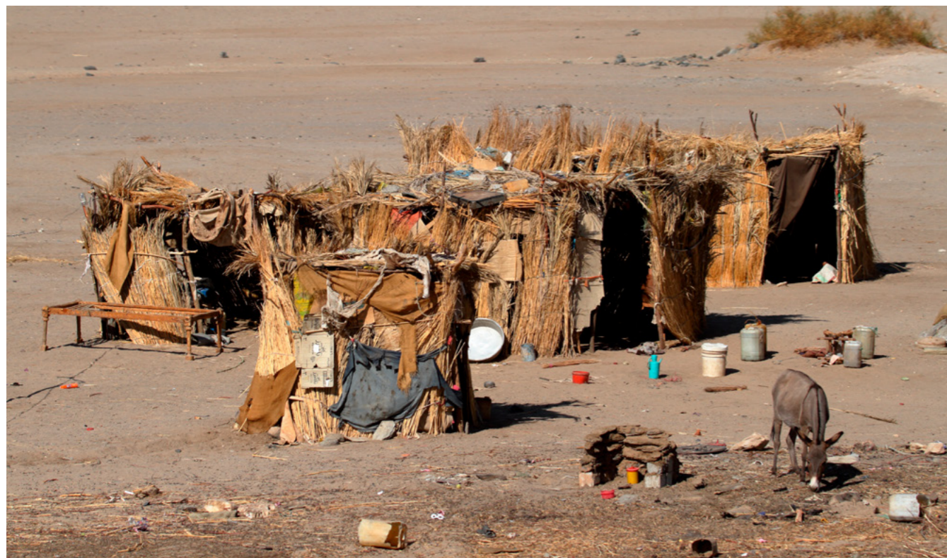
Der „Global Humanitarian Overview 2021“ der Vereinten Nationen führt die Corona-Pandemie zu einem drastischen Anstieg extremer Armut weltweit.

an. Auch deshalb ist der Energiesektor ein zentrales Element des Pariser Klimaabkommens und ein wichtiger Anknüpfungspunkt, um die Erderwärmung zu begrenzen. Auf dieser Grundlage ist es notwendig, den Anteil erneuerbarer Energien am globalen Energiemix zu steigern und die Energieeffizienz zu erhöhen. Die Energieversorgung der Zukunft muss weltweit bedarfsgerecht, zuverlässig und nachhaltig sein.