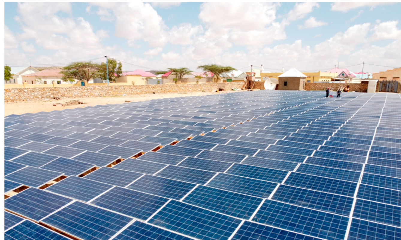
Viele Regionen des Globalen Südens beherbergen ein immenses Erneuerbare-Energien-Potential. So bietet Marokko beste Voraussetzung für die Erzeugung von Solarstrom oder Wasserstoffproduktion.

Die weltweite Wasserkrise führt nicht nur direkt zu einer Unterversorgung mit sicherem Trinkwasser, sondern bildet auch die