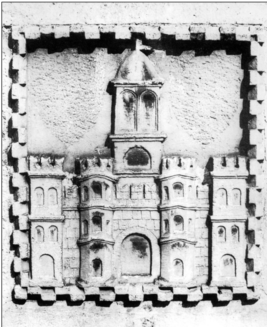
Sl. 2: Grb grada Splita na komunalnoj palači. Fig. 2: Split coat of arms on the City Hall.