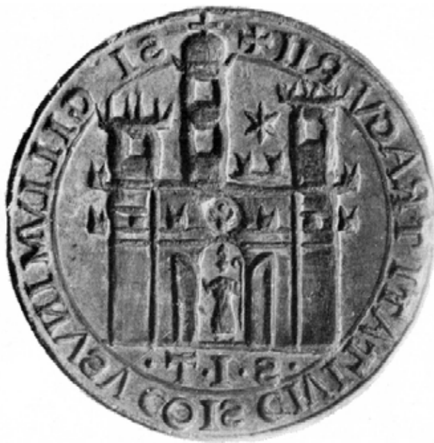
Sl. 3: Pečat trogirske komune iz XIII. stoljeća.