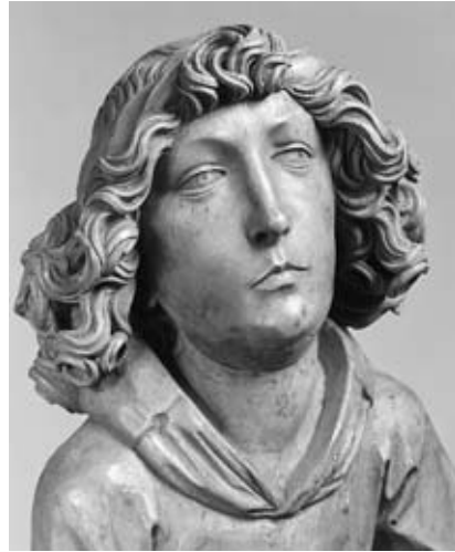
5. Tilman Riemenschneider, Angel svečonosec, Victoria and Albert Museum, London, 1490–1500, glava

skupen domala vsem angelom, narejenim v zgodnjem Riemenschneiderjevem obdobju do okoli leta 1505. Njihova tipska oblikovanost in nižja kvaliteta kažeta na delavniško delo in množično produkcijo. Posebej nanj spominja klečeči angel svečonosec iz Victoria and Albert Museum v Londonu, datiran v čas med leti 1490 in 1500 in pripisan Riemenschneiderju oz. njegovi delavnici. 20 Njegov obraz z ozkim nosom, majhnimi usti, luknjico v bradi in z za spoznanje daljšo pričesko s skoraj identično razporejenimi kodri, ki obkrožajo obraz z resnobnim in rahlo brezizraznim pogledom, med vsemi ostalimi obravnavanimi deli še najbolj spominja na obraz sv. Lovrenca iz Stranic njemu ga pri-