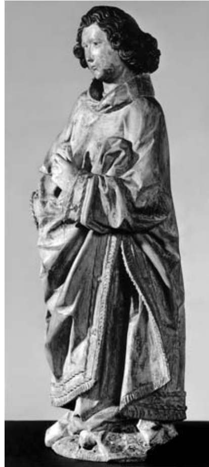
3. Sv Lovrenc iz Stranic pri Konjicah, pogled od strani

nimi, majhnimi očmi. Glavo, nagnjeno proti levi, uokvirjajo polžasti kodri. V nasprotju z nagibom glave se telo nagiba proti desni in ustvarja labilen stojni motiv. Desnica, ki je od zapestja navzdol odlomljena, je stegnjena ob telesu in je najverjetneje nekoč držala raženj, levica mu skrčena počiva na prsih, privzdiguje dalmatiko in s tem ustvarja gubo oblačila, v njej pa je nekoč držal palmo mučeništva. 4 Svetnik je oblečen v diakonsko dalmatiko, obrobljeno z resicami, nad katerimi je vrvičast obšiv. Med obema obšivoma se nahajajo še enakomerno razporejeni