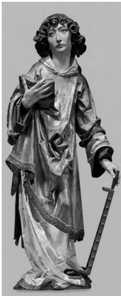
9. Tilman Riemenschneider, Sv. Lovrenc, Cleveland, 1490–1492