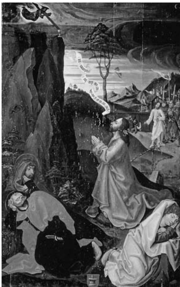
12. Krog Michaela Wolgemuta, Kristus na Oljski gori. Narodna galerija Ljubljana, pred 1495

skem polju. 36 Glede na veliko število članov najuglednejših štajerskih rodbin in vplivnost le-te bi se dalo sklepati, da je kip sv. Lovrenca prišel na slovensko Štajersko s posredovanjem člana te bratovščine, k čemur napeljuje tudi nürnberška slika Kristus na Oljski gori s Koritnega nad