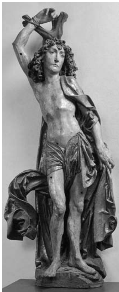
7. Tilman Riemenschneider, Sv. Sebastijan, Bayerisches Nationalmuseum München, 1490