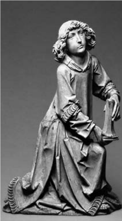
4. Tilman Riemenschneider, Angel svečonosec, Victoria and Albert Museum, London, 1490–1500