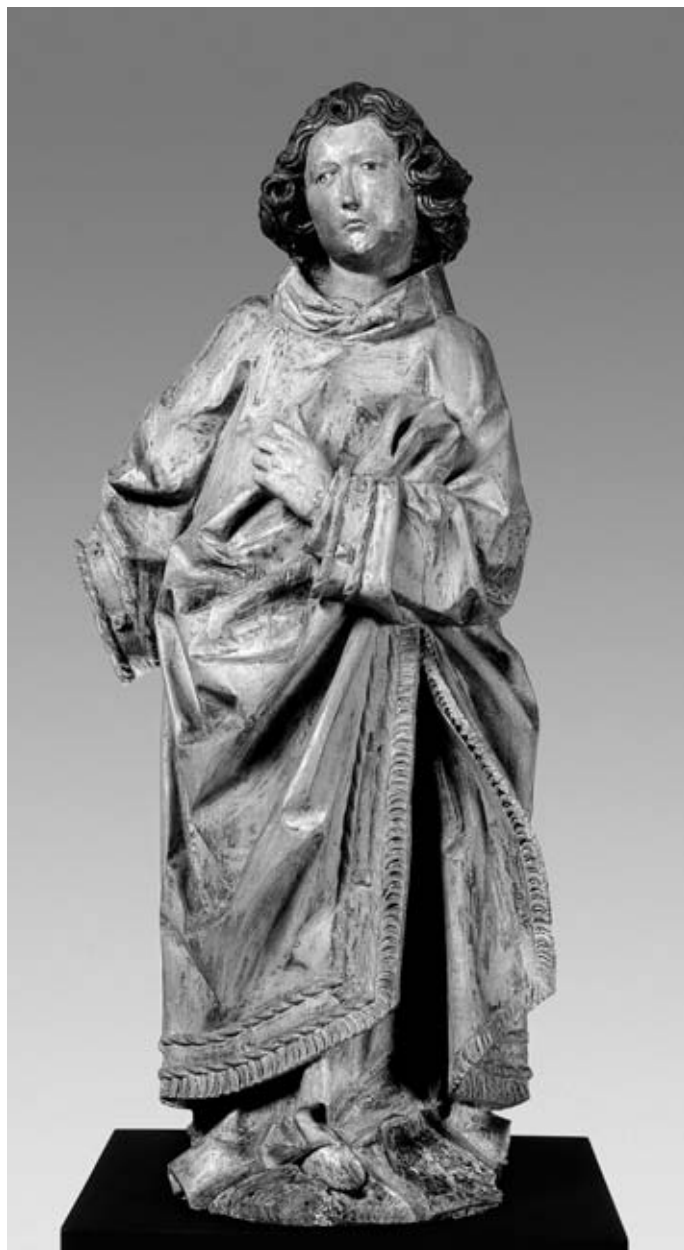
1. Sv. Lovrenc iz Stranic pri Konjicah, Narodna galerija Ljubljana, 1490–1495