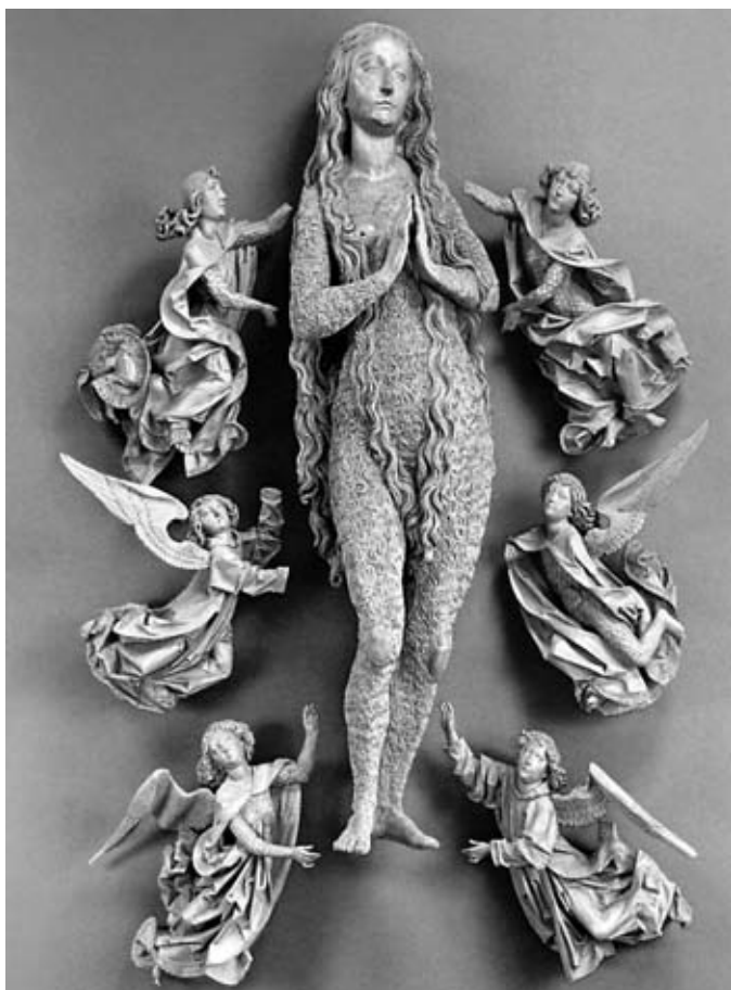
6. Tilman Riemenschneider, Marija Magdalena in angeli, oltar Marije Magdalene, Bayerisches Nationalmuseum München (iz Münnerstadta), 1490–1492

bliža še diakonska dalmatika, ki jo je Riemenschneider velikokrat uporabil kot oblačilo angelov.