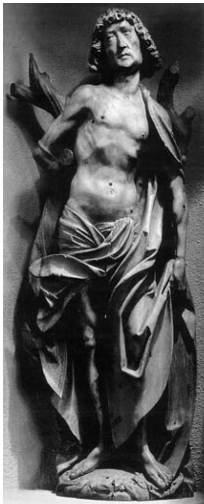
8. Tilman Riemenschneider in delavnica, Sv. Sebastijan, c. sv. Lovrenca, Gabolshausen 1515–1520

spreminjaju načina gibanja dokaj konzervativen in se je te drže oklepal praktično od začetka do konca umetniškega ustvarjanja, prav tako pa so jo posvojili tudi njegovi učenci in delavnica. Bolj kot v reliefih pride do izraza v obli plastiki, kjer je opaznejša in močneje poudarjena v zgodnjih delih, kakor npr. pri sv. Sebastijanu iz okoli 1490, hranjenim v Bayeri-