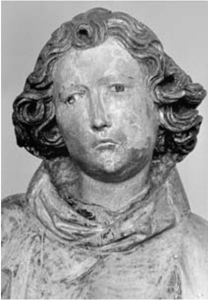
2. Sv Lovrenc iz Stranic pri Konjicah, glava