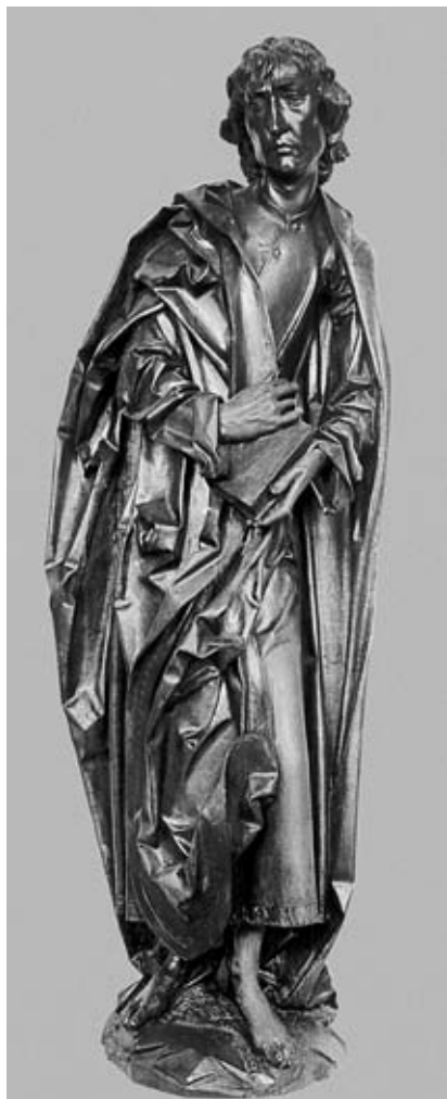
10. Tilman Riemenschneider, Janez Evangelist, cerkev Marijinega Vnebovzetja, Aub, ok. 1500

Za figuro sv. Lovrenca, ki je bil pogosto upodobljen svetnik v Riemenschneiderjevem opusu, se je Riemenschneiderjeva delavnica posluževala bolj ali manj enakih formul in jih je v skladu s časom nastanka ali večjim deležem delavnice le za spoznanje spreminjala. Svetnik je bil upodobljen stoječ z vstran nagnjeno glavo in boki, oblečen v največkrat malo pod kolena segajočo diakonsko dalmatiko s kapuco, obšito