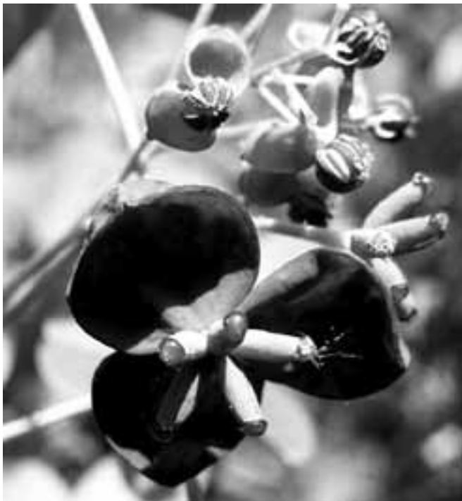
Slika 1: Ženski cvet v ospredju ter socvetje moških cvetov v ozadju

Figure 1: Female flower in front and male flowers at the back