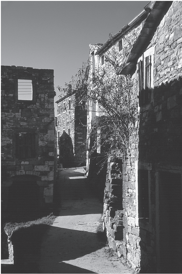
Sl. 1: Strnjene vasi in majhne, kamnite hiše so ključne točke na itinerarju povezanosti s pokrajino.

Fig. 1: Compact villages and small stone houses are key points on the itinerary of connection with the landscape.