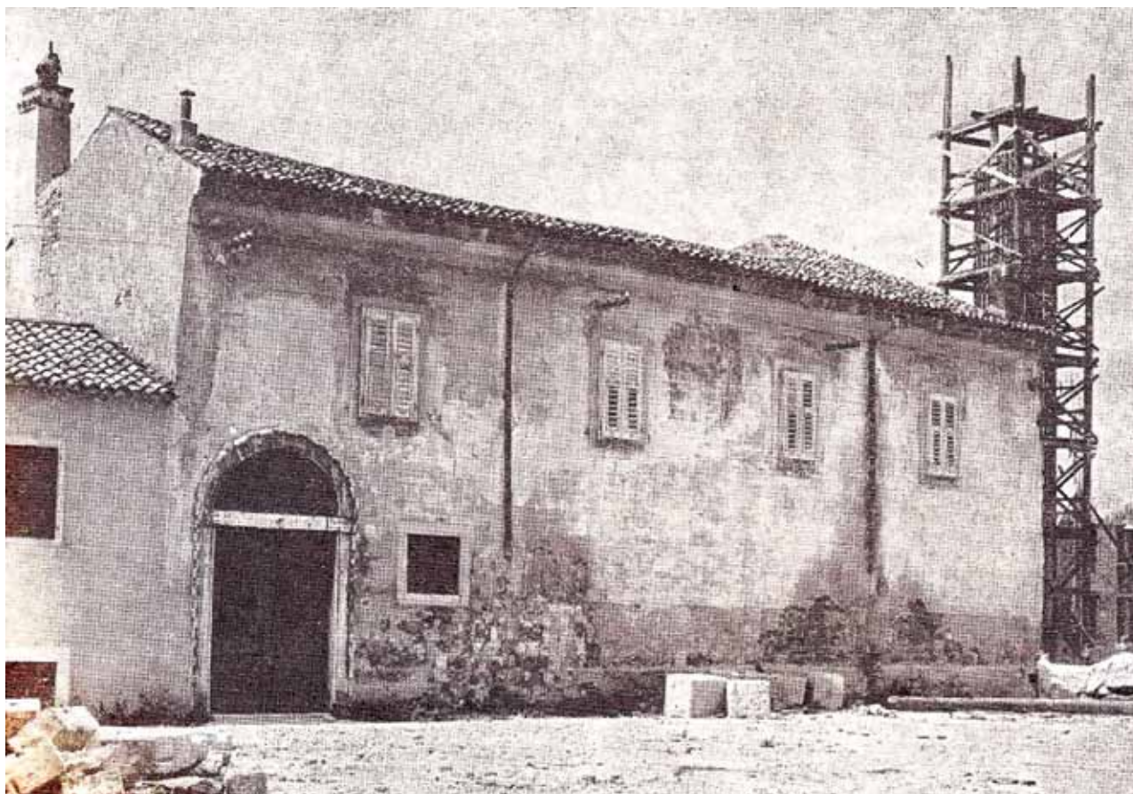
Sl. 5: Ostanke glagoljaškega samostana v petdesetih letih 20. stoletja.