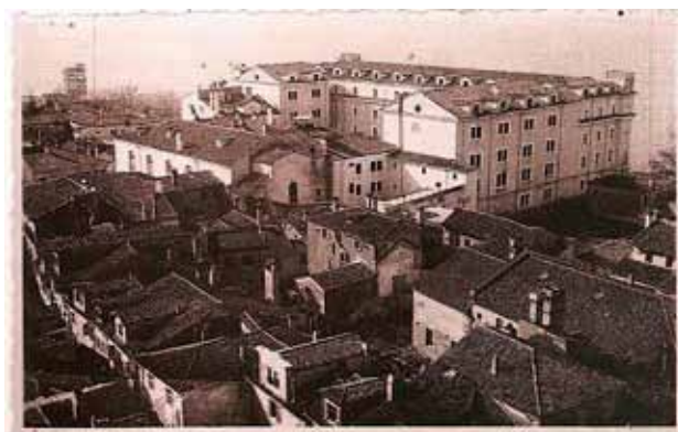
Pogled na koprške zapore z mestnega stolpa. Veduta sulle carceri di Capodistria dal torre civico.

Z dekretom o organizaciji svetne duhovščine in redovništva so oblasti radikalno posegle tudi na cerkveno področje. 25. aprila 1806 so bili s kraljevim dekretom v