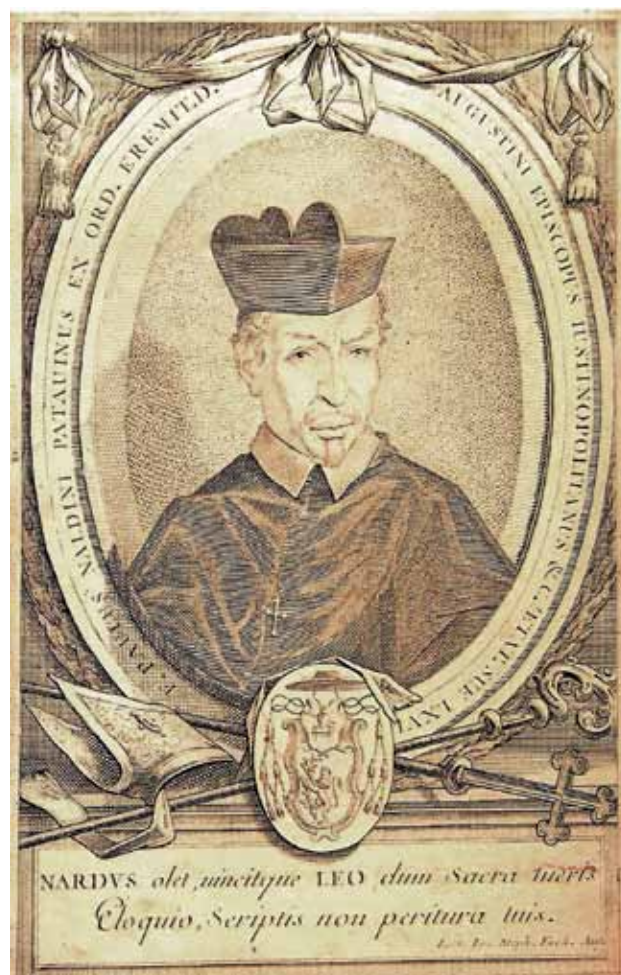
Sl. 2: Koprski škof Paolo Naldini ( Corografia ecclesiastica, Venezia 1700 ).

V Dalmaciji sta se srečali dve glagoljaški tradiciji: ena zahodna, ki je že zdavnaj likvidirala kult sv. Cirila in Me-