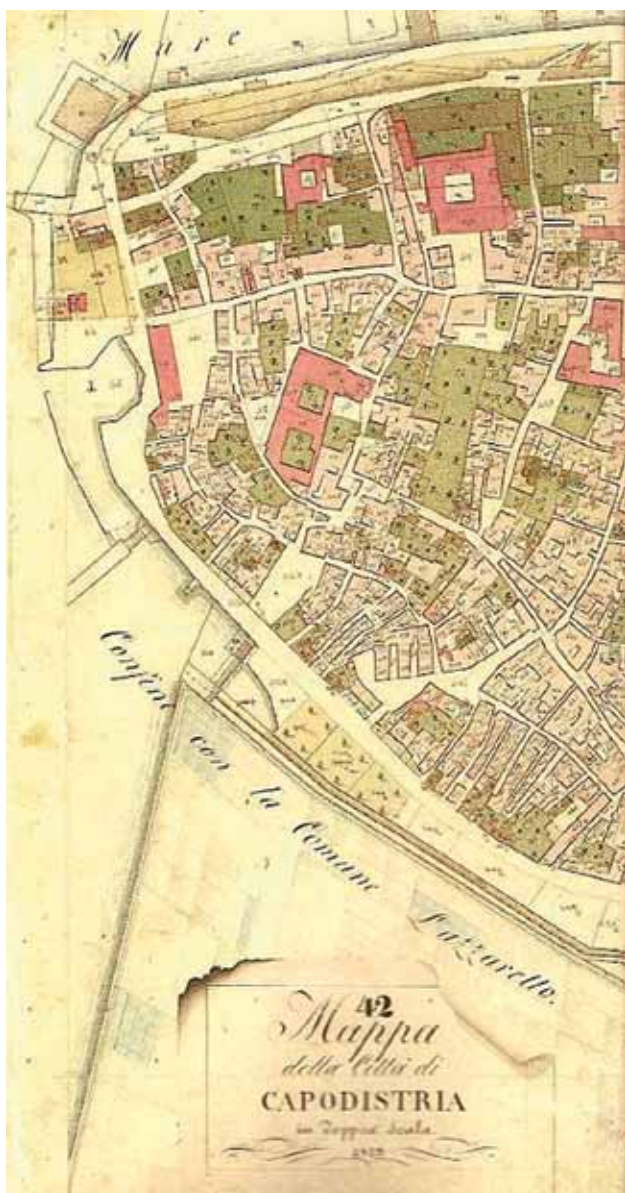
Sl. 3: Območje Zubenage z vrisanim tlorisom dominikanskega in gregoritskega samostana (Pikel, 2004, 18). Fig. 3: La zona di Zubenaga con la pianta incisa del convento domenicano e gregoriano (Pikel, 2004, 18).

toda (ker ju je rimska hierarhija proglašala za heretika), in druga vzhodna (makedonsko-humska-bosanska), ki je ta kult ohranila. To vzhodno so tretjeredniki verjetno prinesli iz Bosne.