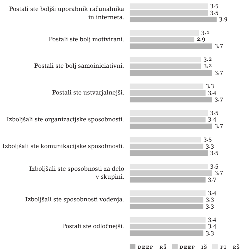
SLIKA 2 Mnenja študentov o spremembah pri spretnostih zaradi sodelovanja v e-učilnici