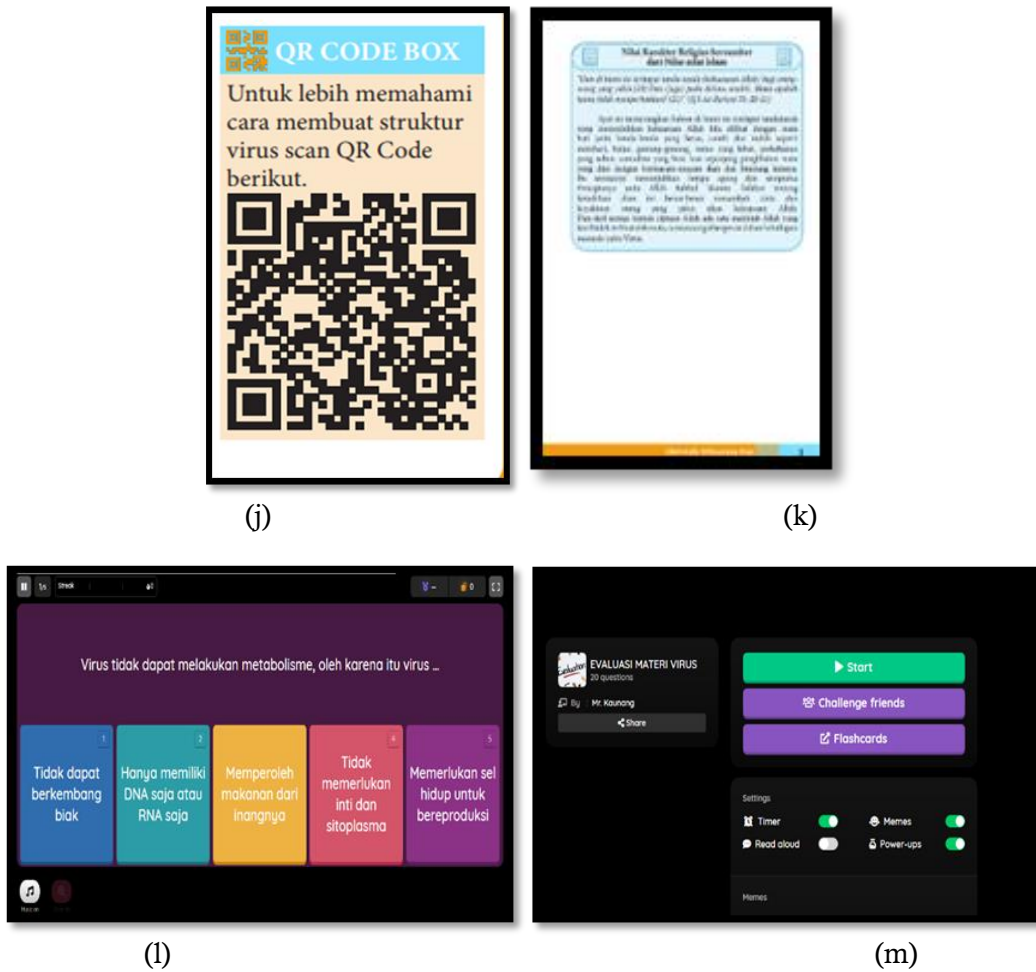
Gambar 1. Hasil dari pengembangan modul yang memiliki komponen-komponen utama yaitu; (a) Cover modul; (b) Kata Pengantar; (c) Daftar Isi; (d) Kompetensi; (e) Peta Konsep; (f) IPK; (g) Petunjuk Penggunaan Modul; (h) Petunjuk Penggunaan QR Code dan E-Learning ; (i) Materi Pokok; (j) QR Code Box ; (k) Integrasi Nilai Islam; (l) Evaluasi menggunakan Quizizz ; (m) Evaluasi Akhir dengan Quizizz .

Berikut merupakan sajian validasi data hasil validasi oleh ahli materi dan evaluasi pada Tabel 3.