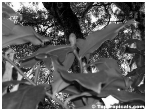
Figura 1 - Costus spicatus

Informações etnofarmacológicas registram o uso das raízes e rizomas como diurético, tônico, emenagogo e diaforético, enquanto o suco da haste fresco diluído em água tem uso contra gonorréia, sífilis, nefrite, picadas de insetos, problemas da bexiga e diabetes (ALBUQUERQUE, 1989; VAN DEN BERG, 1993; CORRÊA et al., 1998; VIEIRA & ALBUQUERQUE, 1998; MORS et al., 2000).