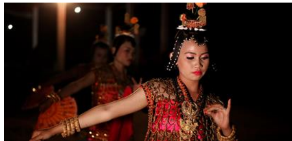
Gambar 4. Tarian Lariangi

adalah Tarian Lariangi [Gambar 4]. Lariangi secara harfiah berasal dari dua suku kata yakni lari yang bermakna berhias dan angi yang bermakna berpesan sehingga dapat dimaknai sebagai orang yang berhias dan menyampaikan pesan. Tarian ini menggunakan bahasa Kaledupa kuno yang saat ini sudah tidak dipahami maknanya meskipun masih tetap dilestarikan. Pakaian dan riasan yang digunakan juga sangat berbeda dengan budaya lain di Kepulauan Wakatobi bahkan Kepulauan Buton. Oleh karenanya, pakaian Lariangi biasanya dijadikan grafis promosi wisata di Wakatobi. Tarian Lariangi juga menggunakan seperangkat alat musik gamelan dan memiliki corak Hinduisme pada pembukaannya serta gerakan lambat dengan ekspresi datar seperti Tarian Serimpi di Jawa (Sofian, 2018). Dengan segala keunikan yang dimiliki tarian ini, Pemerintah Daerah Wakatobi sedang berupaya mengusulkan untuk mendaftarkan Lariangi agar menjadi warisan dunia tak benda oleh UNESCO. Seluruh atraksi budaya ini juga ditampilkan pada Festival Barata Kahedupa setiap bulan September.