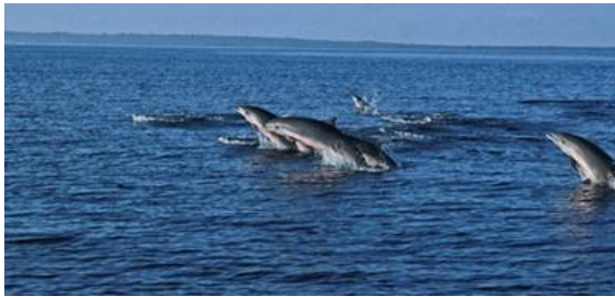
Gambar 2. Atraksi migrasi lumba-lumba di perairan Wangi-Wangi dan Kapota

Wakatobi masih lebih tinggi ( H' = 1.06 hingga 1.20 ) dari Kepulauan Seribu ( H' = 0.76 hingga 1.02 ).