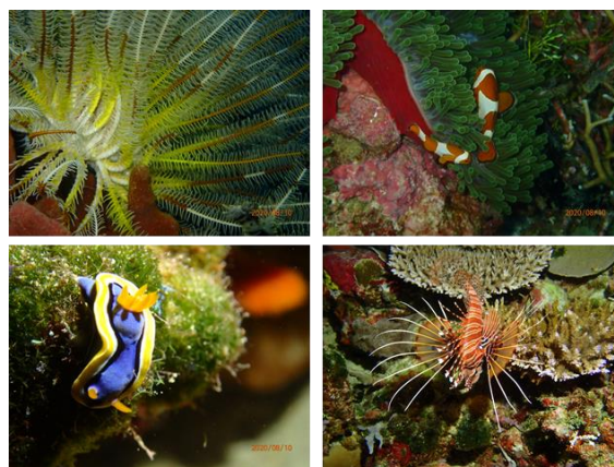
Gambar 1. Keindahan bawah laut Pulau Tomia

Rhizophora sp., Avicennia spp, dan Sonneratia spp. yang luasnya sangat besar meskipun tidak ada daerah aliran sungai di pulau ini. Bagian utara pulau memiliki karakter mangrove yang dapat dilakukan penjelajahan dengan berjalan kaki sedangkan bagian selatan memiliki karakter yang hanya dapat dijelajahi dengan menggunakan perahu. Mangrove di Tanjung Sombano yang terletak di utara Pulau Kaledupa menyimpan potensi keindahan alam yang luar biasa karena terdapat danau air asin yang disakralkan masyarakat. Danau ini juga merupakan habitat beberapa satwa bahkan di antaranya adalah satwa endemik (Fisu et al. , 2020; Dinas Pariwisata Pemda Wakatobi, 2012).