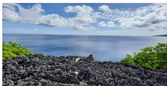
Gambar 3. Lanskap geologi bebatuan di Pulau Binongko