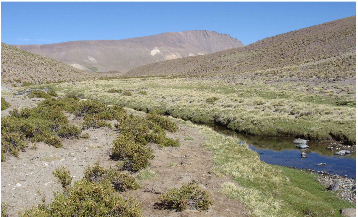
Figura 13: Río donde habita el bagre de montaña más alto registrado para Argentina, Trichomycterus roigi , provincia de Jujuy 4.800 m.s.n.m.