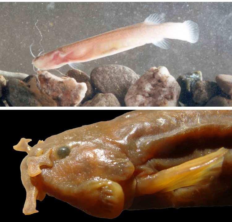
Figura 6: Bagre de montaña endémico de la Cordillera, detalle de la cabeza de Trichomycterus ramosus con las barbillas cortas, anchas y ramificadas dos o más veces, Laguna Blanca, Catamarca.

Algunos autores creen que la gran capacidad para dispersarse ( vagilidad ) de los tricomictéridos se debe a la presencia de los odontoides en los huesos del opérculo e interopérculo (carácter sinapomórfico o condición derivada compartida de la familia Trichomycteridae), que les permite subir contra la corriente anclándose al sustrato o para no ser arrastrados por las crecidas estivales o los deshielos en alta montaña. Y en casos extremos, como los bagres parásitos conocidos como candirú o pez vampiro, también pertenecientes a los tricomictéridos (subfamilias Stegophiliinae y Vandellinae), estas estructuras se modifican como ganchos para ayudar a fijarse a los otros peces mientras se alimentan de la sangre en las branquias ( vandelines ) o del mucus del cuerpo raspando externamente ( estegofilines ) (Fernández 2010).