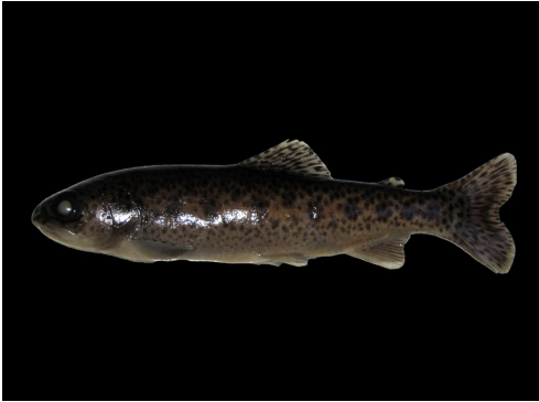
Figura 2: Trucha arco iris Onchorhynchus mykiss obtenida del Parque Nacional el Leoncito, provincia de San Juan.