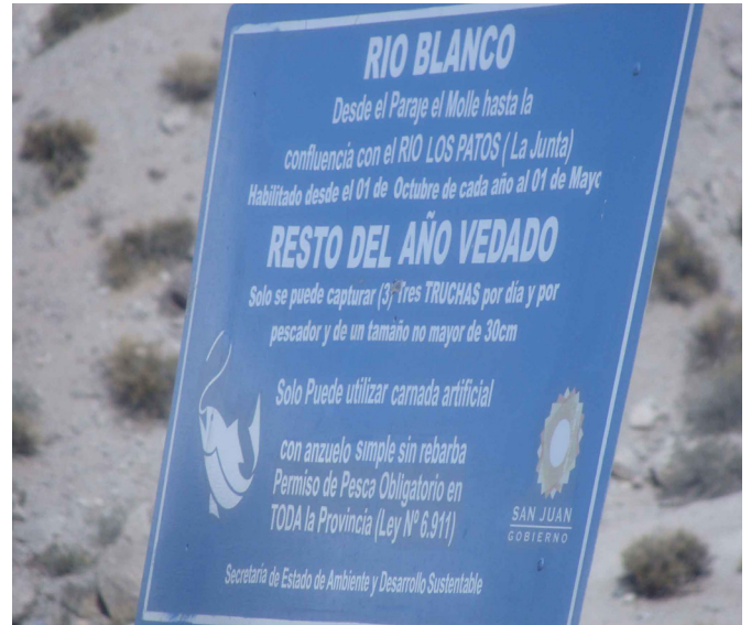
Figura 12: Carteles de protección de la trucha arco iris en la Cordillera: "Habilitado desde el 01 de Octubre de cada año al 01 de Mayo. Resto del año vedado. Solo se puede capturar (3) Tres Truchas por día y por pescador y de un tamaño no mayor a 30 cm. Solo puede utilizar carnada artificial con anzuelo simple sin rebarba".

están tomando algunas medidas, como la erradicación de las truchas arco iris (Figura 11) con pesca eléctrica en el Parque Nacional Leoncito en San Juan, donde vive un bagre endémico ( Silvinichthys leoncitensis Figura 4). Pero en las provincias del NOA continúan las políticas de siembra y resiembra en arroyos de cordillera e incluso con mayor difusión de las medidas de protección (Figura 12). Ante la propagación de las truchas, a los bagres nativos de los Andes no le queda otra opción que subir y restringirse en el refugio de las vegas o nacientes de los ríos donde la profundidad del agua es un limitante para la competencia/predación de las truchas (Figura 13).