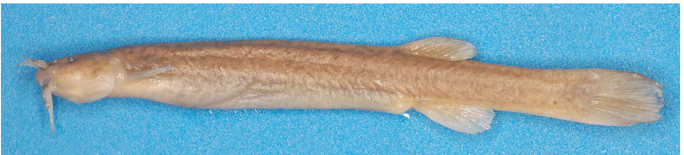
Figura 4: Bagre andino cuyano Silvinichthys leoncitisensis (MCN 1511 holotipo IBIGEO-Museo Ciencias Naturales Salta) que habita en el Parque Nacional el Leoncito 1.213 m, provincia de San Juan.