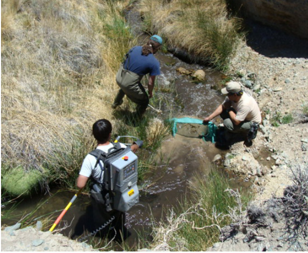
Figura 11: Erradicación de la trucha arco iris en el Parque Nacional Leoncito, San Juan, donde habita Silvinichthys leoncitensis endémica de la Cordillera.

están tomando algunas medidas, como la erradicación de las truchas arco iris (Figura 11) con pesca eléctrica en el Parque Nacional Leoncito en San Juan, donde vive un bagre endémico ( Silvinichthys leoncitensis Figura 4). Pero en las provincias del NOA continúan las políticas de siembra y resiembra en arroyos de cordillera e incluso con mayor difusión de las medidas de protección (Figura 12). Ante la propagación de las truchas, a los bagres nativos de los Andes no le queda otra opción que subir y restringirse en el refugio de las vegas o nacientes de los ríos donde la profundidad del agua es un limitante para la competencia/predación de las truchas (Figura 13).