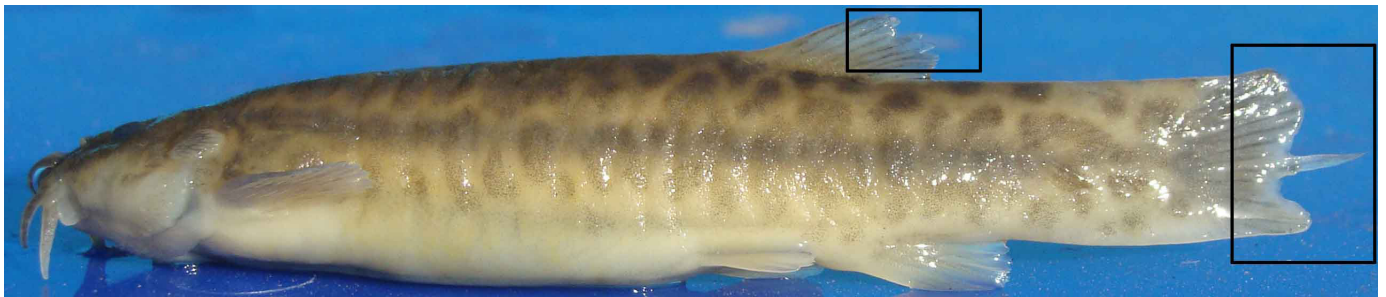
Figura 9: Trichomycterus sp. de un arroyo de la cordillera con la aleta caudal mutilada por la trucha arco iris.

La introducción de la trucha arco iris (Figura 2) en la cordillera (1904) y especialmente en la Puna (1960) no tiene consecuencias menores, debido a que el impacto registrado a la fauna de macroinvertebrados y bagres nativos, algunas veces endémicos, aún está poco estudiado. La invasión de una especie exótica, una vez establecida, difícilmente podrá erradicarse, a diferencia de un contaminante con una fuente emisora localizada que puede controlarse. Por ejemplo, en un arroyo de cordillera, coexiste una especie de Trichomycterus con las truchas arco iris (conocidas por su voracidad (Fernández en preparación). Cuando el río comienza a retraerse por la sequía aumentan las concentraciones de peces, lo que sumado al menor número de macroinvertebrados bentónicos, hace que en los ejemplares de Trichomycterus se puedan observar aletas mutiladas (Figura 9). Este es el primer caso registrado de que las truchas se alimentan de las aletas de peces nativos andinos. Los registros anteriores son a partir del contenido estomacal de las truchas, pero difícilmente se puedan observar los restos diminutos de aletas con la consiguiente interpretación errónea que las truchas no depredan sobre peces nativos y por ello antes de promover su erradicación se piensa equivocadamente en una explotación sustentable.