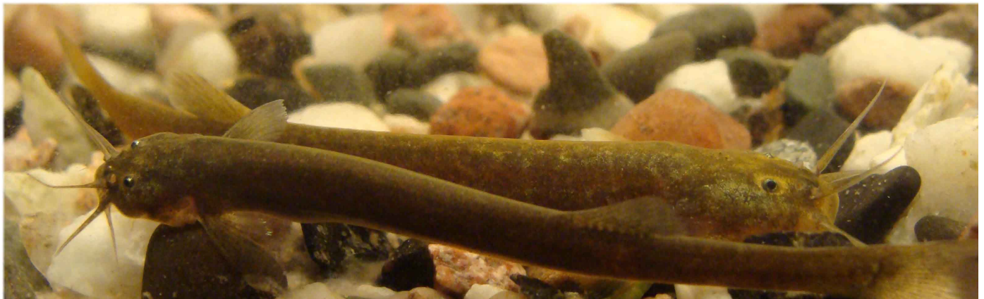
Figura 3: Bagre estigófilo Trichomycterus catamarcensis de la Reserva Biosfera Laguna Blanca 3.500 m.s.n.m, provincia de Catamarca.

En los Andes de Argentina el número de peces encontrados llega a 46 especies por encima de los 1.000 m de altura sobre el nivel del mar. Esta delimitación subjetiva (el límite de 1.000 m) ha sido seguida por diversos autores como Ortega (1992) y Schaefer (2011). La mayor riqueza corresponde a un grupo de bagres (Figura 3) pertenecientes a la familia Trichomycteridae (Orden Siluriformes) con 25 especies distribuidas en tres géneros ( Hatcheria , Silvinichthys y Trichomycterus ), de las cuales 9 corresponden a endemismos (Tabla 1) y de ellos 5 se definen como especies alto andinas (Tabla 1), esto es por encima de los 3.000 m de altura sobre el nivel del mar. En Argentina el mayor registro altitudinal conocido corresponde a Trichomycterus roigi de 4.800 m en la provincia de Jujuy. De los tres géneros de la subfamilia Trichomycterinae en Argentina, los Silvinichthys (Figura 4) son los únicos exclusivamente andinos, entre los 1.000 y 3.000 m de altura. Ocupan a veces ambientes de escasa profundidad (no mayores a 2 cm) como en el Parque Nacional Leoncito en San Juan, o bien en aguas subterráneas como en el río Arenales de Salta (Figura 5) o aguas termales en Los Nacimientos, Catamarca. Es importante destacar que en la Puna Argentina, hasta el momento, no fueron registrados ejemplares de Astroblepidae (Siluriformes), ni del género Orestias (Cyprinodontiformes) como ocurre en ambientes similares del Altiplano de Chile, Bolivia o Perú.