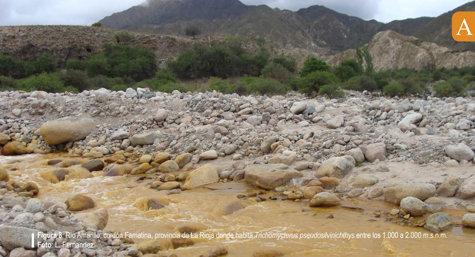
Figura 8: Río Amarillo, cordón Famatina, provincia de La Rioja donde habita Trichomycterus pseudosilvinichthys entre los 1.000 a 2.000 m.s.n.m.