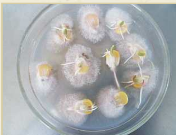
FIGURA 3. Colonias de F. verticillioides desarrolladas a partir de semillas en medio de cultivo APG.