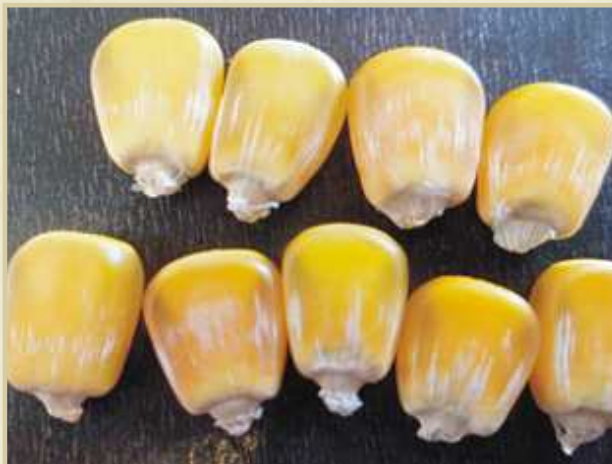
FIGURA 1. Semillas de maíz con síntomas de estrías blancas causadas por Fusarium verticillioides .