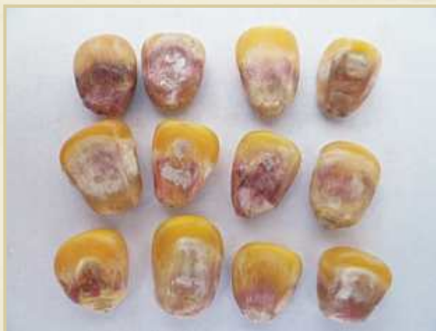
FIGURA 2. Semillas de maíz con síntomas provocados por Fusarium graminearum .