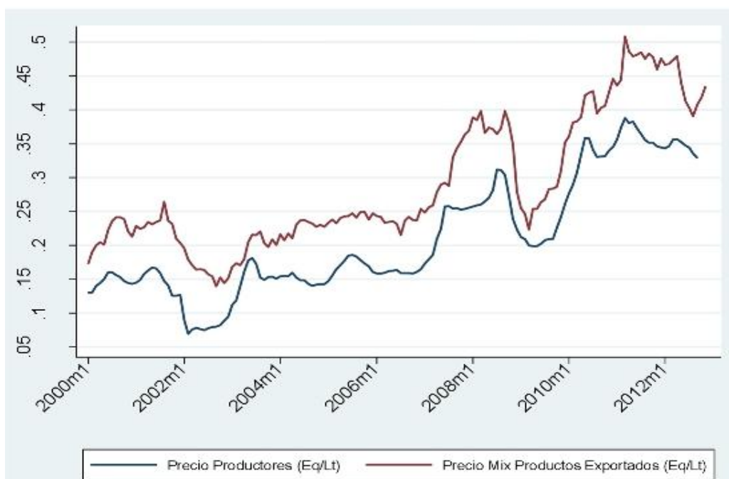
Figura 1. Precio Mix de Productos Exportados y Productor

A su vez, para determinar la causalidad de un precio sobre otro, se realiza el test de causalidad de Granger para determinar si los precios al productor causan los precios de exportación que reciben las empresas lácteas o si a la inversa, los precios que reciben las empresas por sus productos en el mercado internacional tienen efecto sobre el precio pagado a los productores ( Tabla 2 ). Este test indica que los precios que reciben las empresas por sus productos en el mercado internacional causan o tienen efecto sobre los precios que reciben los productores.