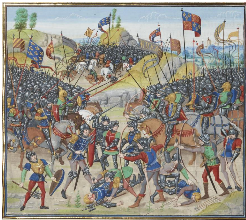
Fig. 8. Jean Froissart, Chroniques (Paris, Bibliothèque nationale de France, Mss, fr. 2643, f. 292r)

dada su fragilidad, la pintura y los tapices de la época presentan las banderas asociadas, principalmente, a la guerra, al mar y a las entradas reales 34 .