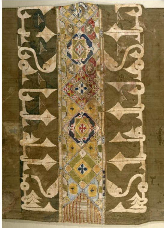
Fig. 2. Tiraz de Colls, siglo XI, Museo de Huesca

La escritura se realizaba, por tanto, con materiales nobles, con seda e hilo de oro, y se ubicaba en los bordes de la prenda. Se confeccionaban también bandas o franjas de tiraz que podían ser aplicadas en las mangas de los trajes y en los tocados (turbantes) (Partearroyo Lacaba, 2007, 378) 16 . En estas inscripciones se elogiaba a Allah , a los califas y visires, se incluían bendiciones, fórmulas de buen presagio («prosperidad», «gloria», «buena fortuna») o se indicaba el lugar y el artífice de la confección («hecho en...») (Serrano-Niza, 2006, 30; Feliciano, 2019, 292). En su estudio sobre el lenguaje de la indumentaria a partir de la famosa antología de canciones y