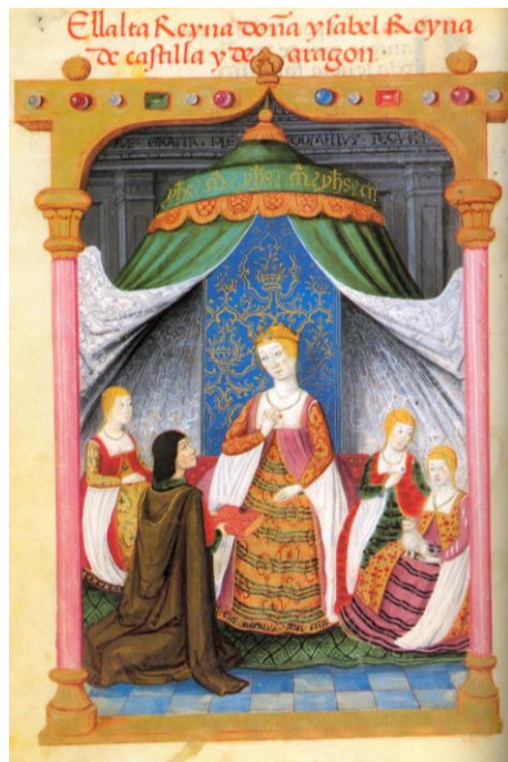
Fig. 5. Pedro Marcuello, Cancionero . Miniatura ejecutada entre 1492-1495