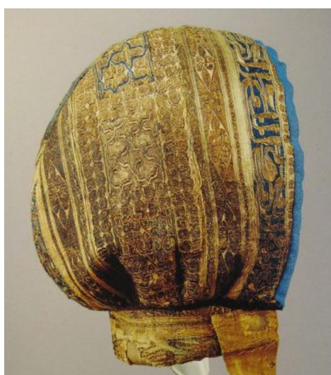
Fig. 10. Cofia del infante don Fernando de Castilla. Monasterio de Santa María la Real de las Huelgas

(mote, lema) que la completa, letra que puede ser un poema. En tales casos, muchas de estas muestras son también ejemplos de poesía expuesta, de poesía visual, de epigrafía poética. La pintura medieval y renacentista refleja esta moda y presenta numerosos testimonios de imágenes de vestidos con letras, lo mismo que la ficción sentimental y las obras que nos ocupan muestran ejemplos de vestidos (d)escritos con lemas y, por tanto, de vestidos para leer.