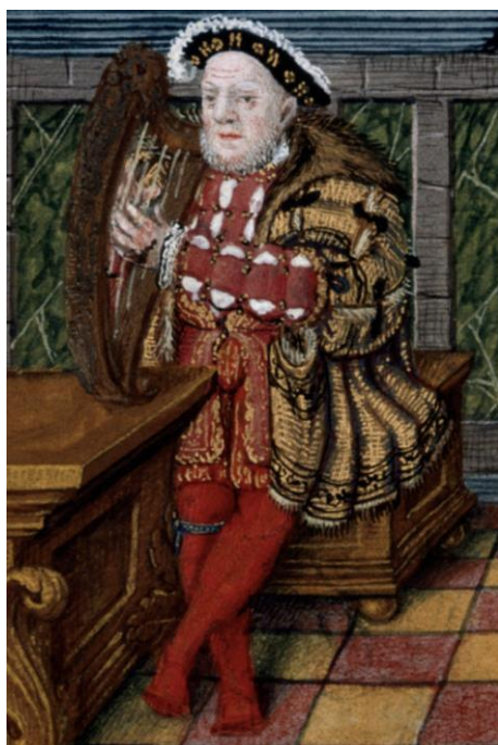
Fig. 12. Psalter of Henry VIII , ¿1542?, British Library, Royal Ms. 2 A XVI, f. 63 v

Ilegible resulta a priori la inscripción que aparece en la liga que muestra Enrique VIII en una miniatura del Psalterio (1542) de Enrique VIII, de Jean Maillard (Fig. 12) 46 .