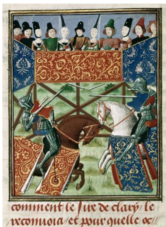
Fig. 7. Jean Froissart, Chroniques , c. 1470-1472

Dentro de esta arquitectura textil adornada con letras se encuentra también el palenque, el cercado que delimita el campo del «juego caballeresco», y la «tela», «la que se arma de tablas para justar» 33 .