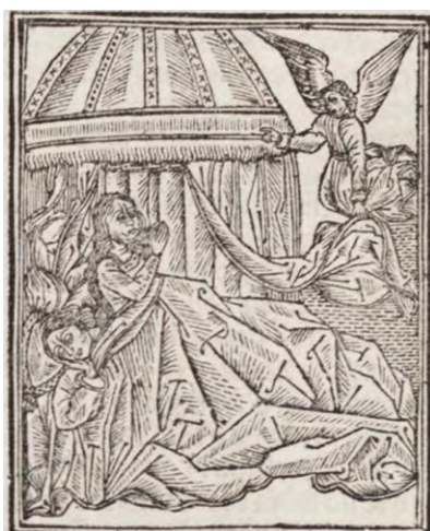
Fig. 4. Baladro del sabio Merlín , Burgos, 1498

La duquesa ejecuta, por tanto, dos labores. Labra un pabellón para cama, es decir, una colgadura para un tipo de cama con remate cónico superior, como el que figura en el grabado del Baladro del sabio Merlín (Burgos, 1498, f. XLlr) o los de las tiendas de campaña luego comentadas 26 .