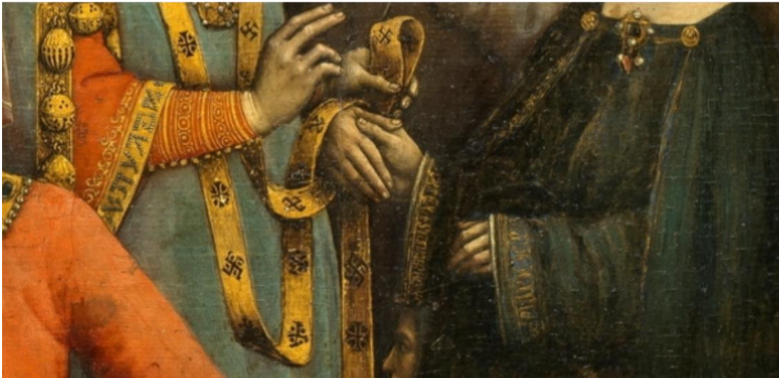
Fig. 11. Detalle de «Los desposorios de la Virgen», Robert Campin, 1420-1430. Museo del Prado

La orla del manto y los bordes de las mangas, son habitualmente las partes de las prendas elegidas para incluir letras, como se advierte en la ya referida pintura de Jan Van Eyck, La adoración del cordero místico (1432) o en los «Los desposorios de la Virgen» de Robert Campin, 1420-1430, donde se aprecian numerosas letras en los atuendos, entre ellas en el manto de la Virgen y en las mangas de su saya (Fig. 11) 45 .