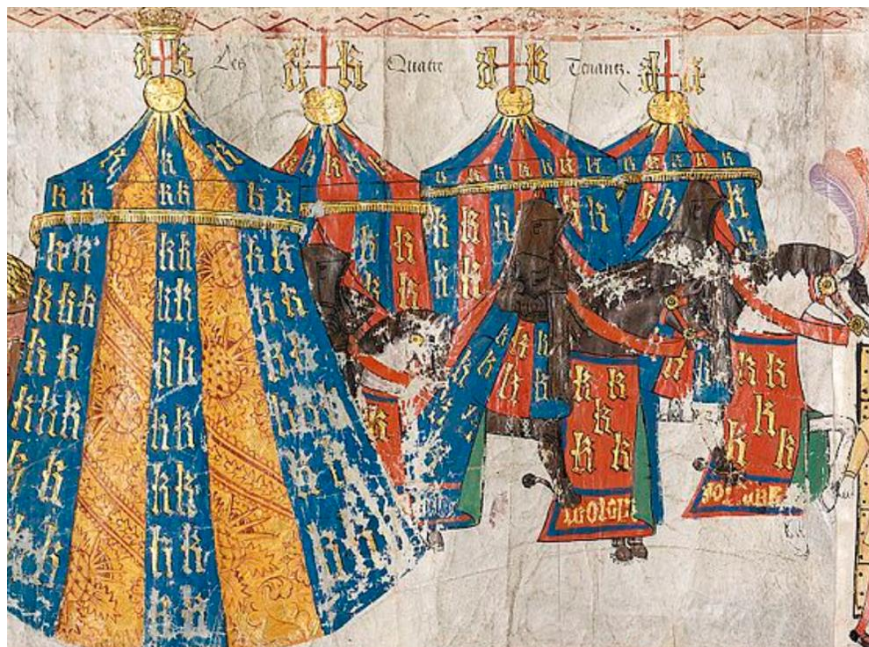
Fig. 6. Westminster Tournament Roll , Londres, College of Arms, 1511