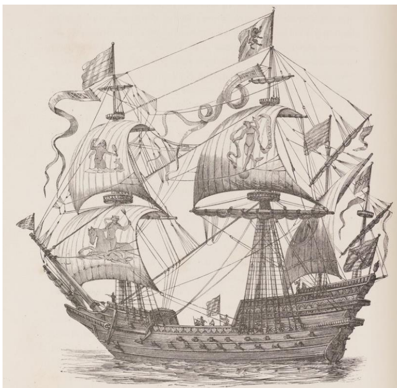
Fig. 9. Galeón español del siglo XVI, estampa grabada por Visscher

El color rojo elegido como fondo de las letras también es simbólico, pues en el libro se asocia a la alegría y lo viste en varias de sus prendas el doncel Mexiano ( Ibid. , 261-262). Las letras, bordadas con hilo de oro y perlitás 39 , encierran un juego verbal a partir del imperativo del verbo esperar, del nombre del protagonista Mexiano de la Esperanza y del de la virtud teológica representada, que lo regalará y protegerá.