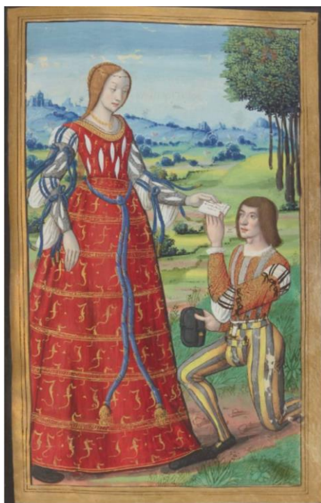
Fig. 13. Fedra, en Octavien de Saint-Gelais, Heroidas , 1497, Bibliothèque nationale de France.

Con motivo también de unas bodas, en el Polismán de Nápoles tres parejas de novios comparecen con ricas prendas adornadas preferentemente por letras, dispuestas alrededor del manto de los caballeros o en el ruedo de la saya de las damas. Jerónimo de Contreras utiliza un mismo patrón en su presentación. En cada caso, describe primero con detalle, y siempre en el mismo orden, las prendas que viste cada uno de los caballeros: jubón y calzas, manto, gorra, espada y regresa de nuevo al manto para transcribir la inscripción que lo orna. Se enfatiza así esta prenda por llevar unas letras que «juntas», es decir, que estarían dispuestas como un continuum , escriben los sentimientos de los novios en este momento. Con el lenguaje cancioneril o con el del refranero, las letras muestran su satisfacción por llegar al matrimonio, entendido como victoria, galardón, lugar