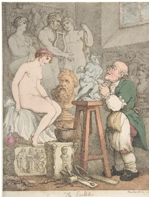
Thomas Rowlandson. The Sculptor , c.1800. Gravura colorida à mão, 29,8 x 23,5 cm. Royal Collection UK.

Segundo Daniele Thom 5 , as mulheres artistas enquanto criadoras de obras tridimensionais enfrentavam dificuldades, pois considerava-se erótico ou sexual, materializar o corpo masculino, sobretudo a partir do estudo de modelo vivo. Essas questões ficam claras ao observar a gravura satírica The Damerian Apollo . A gravura possuía o objetivo explícito de ironizar a escultora e viúva Anne Seymour Damer (1748-1828), bem como as mulheres artistas que se dedicavam a esse tipo de ofício. Na imagem vemos o exato momento em que Anne, com seu cinzel e martelo, esculpe as nádegas de um Apollo Belvedere, em seu ateliê, próxima a uma jovem aprendiz.