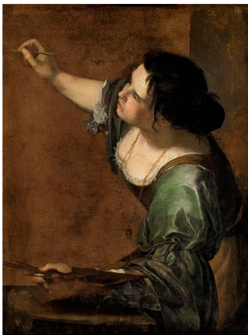
Artemisia Gentileschi. Autorretrato como alegoria da pintura, 1638-1639. Óleo sobre tela, 98,6 x 75,2 cm. Royal Collection UK.

As representações de artistas podem ser pensadas paralelamente ao processo de valorização do ofício 3 . Ainda no século XVI, Vasari, em Vida dos Artistas , reivindicou a distinção dos grandes poetas e artistas da antiguidade para os principais pintores de sua época, a partir das noções de genialidade (VASARI, 1991). Além do gênio artístico, pensado como um poder atemporal e misterioso, a inserção no ensino acadêmico engrandecia o status do artista. O acesso ao treinamento baseado no estudo dos grandes mestres do passado e a defesa de um estilo considerado elevado e idealizante, agregavam distinção e prestígio ao ofício.