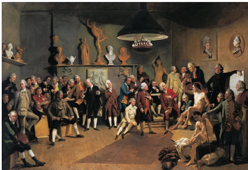
Johan Joseph Zoffany. The Academicians of the Royal Academy , 1771-72. Óleo sobre tela, 101.1 x 147.5 cm. Royal Collection UK.

Johann Zoffany, conhecido pintor alemão que trabalhou durante algum tempo na Inglaterra, produziu um retrato de grupo dos fundadores da Royal Academy of Arts , posteriormente comprado pelo monarca britânico, George III. A tela retrata os 36 artistas, de diferentes nacionalidades, fundadores da instituição. O grupo se dispõe confortavelmente em uma cena de ateliê, meio a modelos despidos e objetos característicos da profissão. Apenas duas artistas estão entre os membros fundadores da Real Academia, Angelica Kauffman e Mary Moser. Na obra, ambas são retratadas através de sua própria representação, enquanto retratos pendurados na parede à direita do observador.