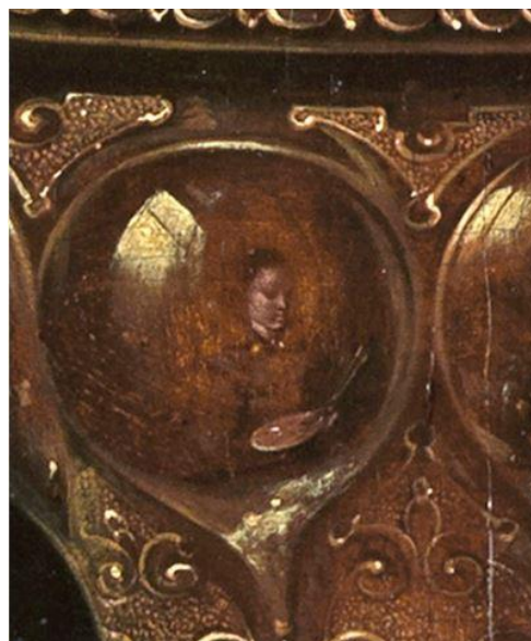
Clara Peeters. Natureza morta com flores, cálices dourados, moedas e conchas, 1612. Óleo no painel, 59,5 x 49 cm. Karlsruhe, Staatliche Kunsthalle.

Às mulheres, era delimitada a produção de gêneros artísticos considerados menores, devido a restrição de acesso às academias e ao estudo do corpo humano. As artistas recorriam então, à temáticas como a natureza-morta, pintura de flores, miniaturas e porcelanas (SIMIONI, 2007, p. 86). Celeste Brusati aponta que a forma de se autorretratar através dos reflexos da prataria, esferas ou espelhos, foi utilizada por artistas holandeses e flamengos com a intenção de se associarem a uma identidade artística que valorizava os aspectos artesanais, mecânicos e técnicos da pintura (BRUSATI, 1990). Em contrapartida, no renascimento italiano por exemplo, a autoconsciência artística é construída através da valorização do status social e intelectual do artista, que muitas vezes buscava em suas representações se distanciar do caráter manual de seu trabalho.