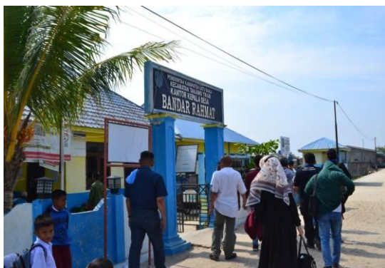
Gambar 3. Tim PKM FT. UISU sampai di Kantor Desa Bandar Rahmat