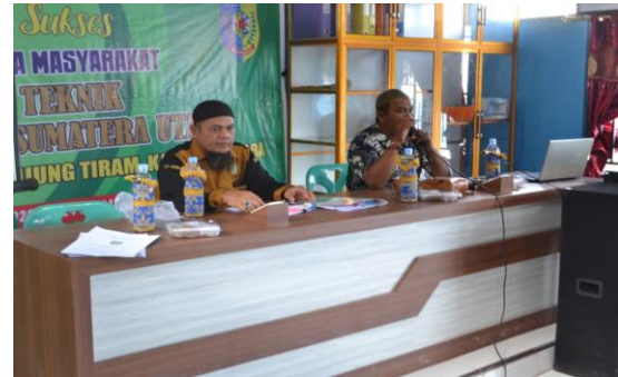
Gambar 5. Kepala Desa Bandar Rahmat memberikan kata sambutan dalam acara PKM