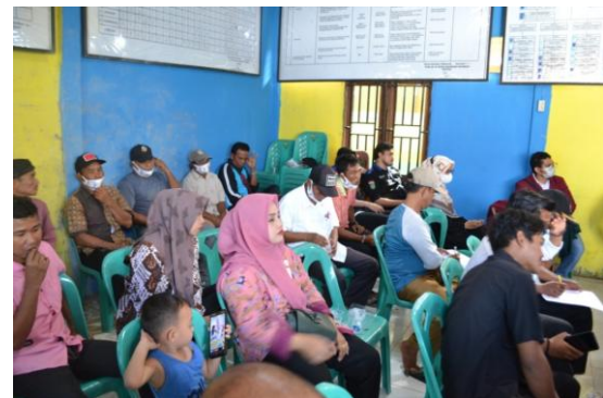
Gambar 6. Peserta penyuluhan PKM di Aula Desa Bandar Rahmat