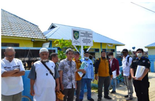
Gambar 4. Tim PKM FT. UISU sampai di Kantor Desa Bandar Rahmat