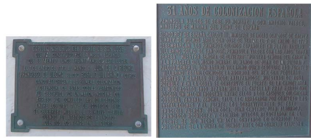
Figura 2. Placas conmemorativas en la réplica de la Capilla del Fuerte San José relativas (a) al malón que habría puesto fin al asentamiento y (b) al recuerdo de la gesta colonizadora.

Figure 2. Commemorative plaques in Fort San José chapel reproduction related to: (a) the aborigine raid that might have ended the settlement and (b) the memory of the colonization.