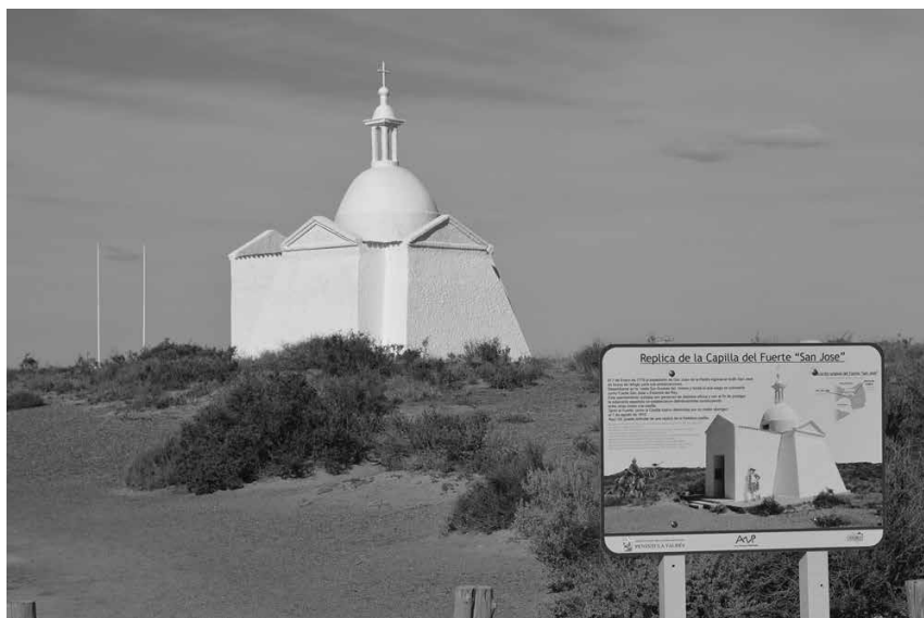
Figura 2. Foto del cartel informativo sobre la réplica de la Capilla del Fuerte San José, Isla de los Pájaros, Península Valdés, Chubut, Argentina.

Hoy en día, la visita turística obligada a la Península Valdés y el imaginario popular tienen como sustento el proyecto de réplica del fuerte, la capilla conmemorativa finalmente levantada y las imágenes de la muestra actual Centro de Visitantes Istmo Carlos Ameghino (ver figura 2). Todos ellos inspirados en los planos correspondientes a edificaciones de la fortaleza de Montevideo y aún más, la capilla en particular, es en realidad una réplica de la capilla de la Ciudadela de Montevideo de fines del siglo XVIII (Bianchi Villelli et al. , 2013).