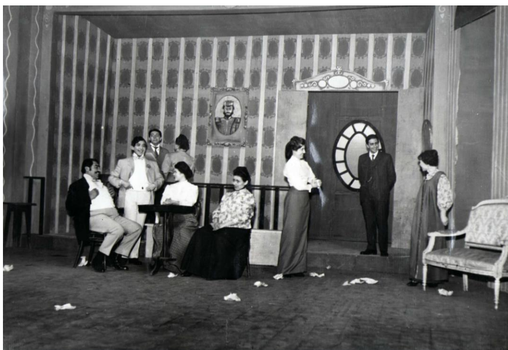
3- Las de Barranco (1960), Teatro Estable de la Provincia.