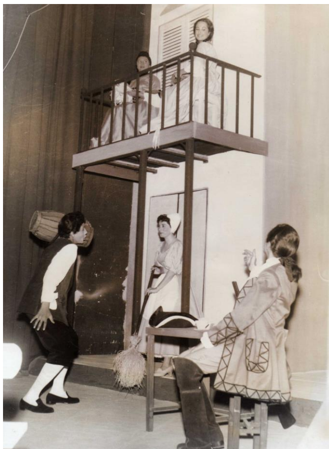
2- El abanico (1959), Seminario de Teatro, Facultad de Filosofía y Letras, UNT.