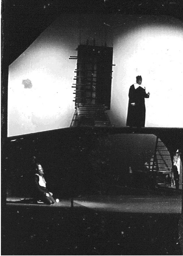
9- El hombre de La Mancha (1973-74)