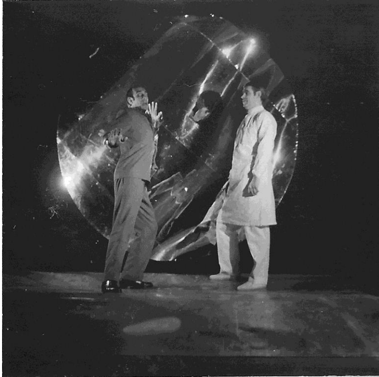
11- Woyzeck (1970)