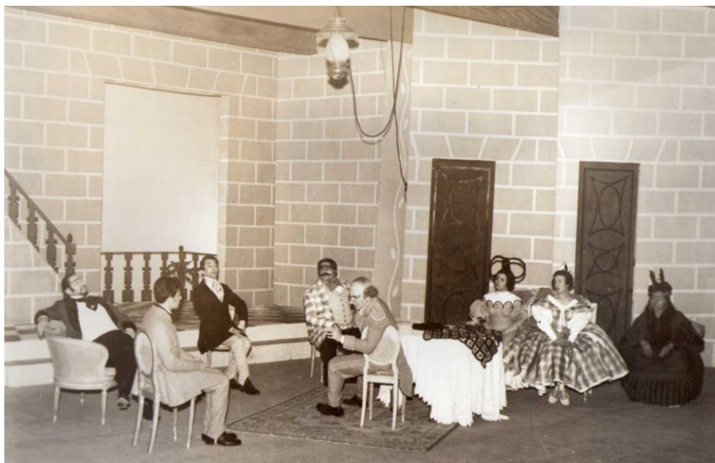
1- El casamiento (1959), Teatro Estable de la Provincia.

Para corroborar e indagar en la utilización de este tipo de escenografía, proponemos observar los siguientes documentos visuales: