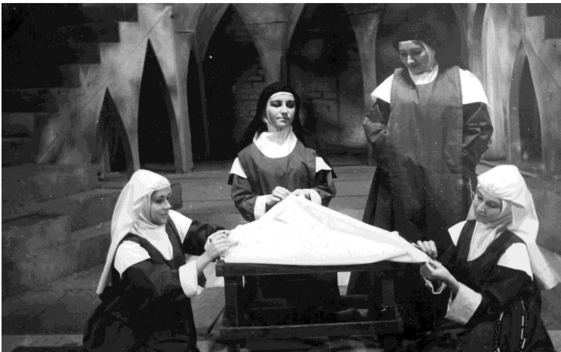
6- Diálogos de carmelitas (1966), Teatro Estable de la Provincia, escenografía A. Lombana.

Al mismo tiempo, las escenografías de tipo “funcional” pueden superar esta reducida visión estética para desarrollar –sin perder sus fundamentos en el texto dramático– eficaces procedimientos poéticos. En este sentido, debemos destacar los trabajos del arquitecto Alberto Lombana 7 quien, durante los años que estudiamos, alcanza importantes niveles de reconocimiento por parte de la crítica teatral especializada y, a su vez, genera una sistematización del trabajo profesional del escenógrafo.