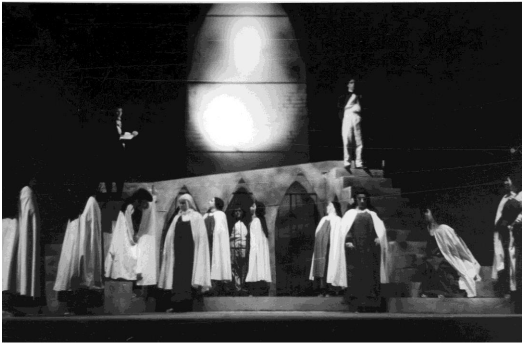
7- Diálogos de carmelitas (1966).