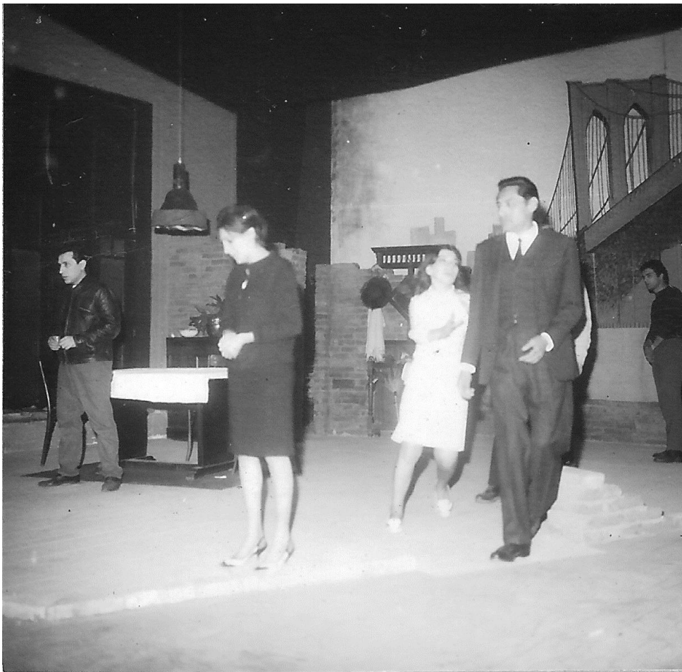
5- Panorama desde el puente (1967), Teatro Universitario.

El montaje escenográfico de la obra Panorama desde el puente de Arthur Miller, bajo la dirección de Boyce Díaz Ulloque y con la colaboración plástico-visual del arquitecto Eduardo Sacriste, constituye un ejemplo de esta variante.