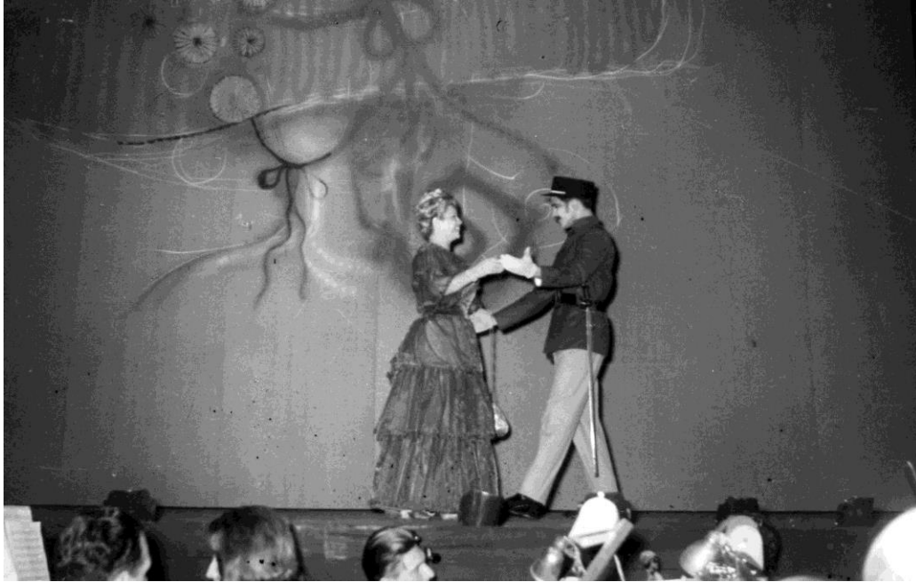
4- Un sombrero de paja de Italia (1965), Teatro Estable de la Provincia.

A partir de este material visual (fotos nº 1, 2, 3 y 4) podemos inferir el uso del espacio escenográfico como “decorado”, vale decir, sin una función actancial precisa, en el que sólo se grafican ambientes o lugares para contextualizar la acción. En este tipo de construcción escénica sobresale la utilización del telón pintado, descriptivo o denotativo, como así también el empleo de dispositivos miméticos, con colores pardos, que actúan como signo “índice”, generalmente, al fortalecer la visión en perspectiva y al apelar al recurso del ciclorama 5 para la ilusión de no contigüidad.