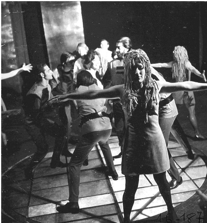
12- Woyzeck (1970)

Desde un punto de vista morfológico, este espacio escenográfico aborda la caja óptica de la sala Biblioteca Alberdi con recursos no ilusionistas, a saber: