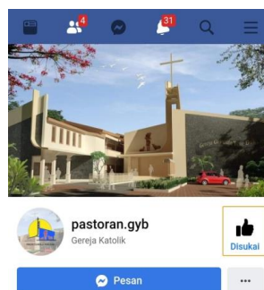
Gambar 1.2 Akun Facebook Paroki GYB

Melalui dua akun media sosial diatas, Paroki sangat berharap banyak mampu memberikan informasi ataupun pelayanan kepada umat secara maksimal. Namun ternyata hal tersebut masih hanya memfasilitasi pelayanan Paroki dalam lingkup kecil, masih banyak bentuk pelayanan yang belum mampu dilakukan secara daring. Terlebih lagi, akun FB dan IG yang seharusnya mampu memperlancar aliran komunikasi antar Paroki dan umat ternyata masih belum mampu secara maksimal dilaksanakan. Bidang Pastoral Komunikasi Sosial (KOMSOS) yang mengelola media komunikasi online tersebut belum mampu bergerak secara maksimal. Keterbatasan kemampuan dan pengetahuan dalam mengelola media online ini yang menjadi masalah tersendiri. Seperti