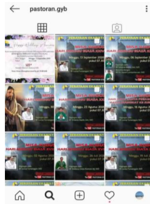
Gambar 1.3 Konten Akun Instagram Paroki GYB

konten dari akun IG Paroki GYB ini yang masih didominasi oleh informasi seputar Sakramen Ekaristi, berikut hasil screen shoot nya: