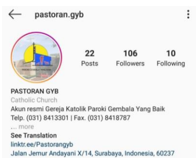
Gambar 1.1 Akun Instagram Paroki GYB

Salah satu pelayanan yang mendapatkan perhatian utama adalah Sakramen Ekaristi yang selama ini rutin setiap hari ataupun dilakukan setiap minggunya terpaksa harus dilakukan secara daring/ online . Hal ini tentunya tidak mudah dilakukan, mengingat Paroki GYB memiliki keterbatasan alat dan juga sumber daya manusia yang mumpuni untuk melakukan itu. Namun dengan segala kemampuan Paroki dan sumbangsih tenaga maupun alat dari umat yang ada, Paroki GYB akhirnya berhasil melakukan live streaming misa online secara rutin setiap minggunya. Guna memperlancar komunikasi antar Paroki dan umat, maka dibuatlah akun Facebook (FB) dan Instagram (IG) untuk memfasilitasi. Berikut akun FB dan IG yang telah dibuat oleh Paroki GYB dan selama ini telah dikelola oleh Tim Broadcating dari Pihak Paroki.