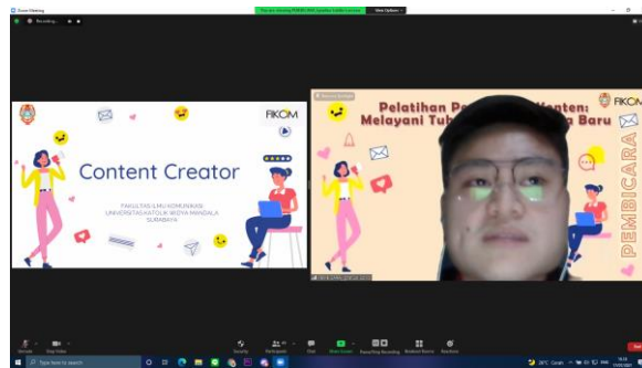
Gambar 4.1. Pemateri Content Creator

Kegiatan pengabdian ini secara teknis menyampaikan materi pelatihan secara bertahap. Tahap pertama adalah pemberian materi mengenai pembuatan konten. Tahap kedua, mengenai fotografi dan videografi. Tahap ketiga, materi mengenai teknis editing video atau audio visual. Pada tahap pertama, mengenai pembuatan konten ini diawali dengan proses yang harus dilalui saat membuat konten. Mulai dari menentukan target market, informasi/ topik apa yang ingin diangkat, pembuatan konten, siap di publikasikan, hingga dilakukan evaluasi.