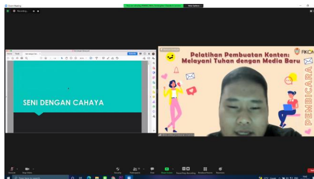
Gambar 4.2 Pemateri Fotografi

Tahap kedua materi mengenai teknik pengambilan foto (fotografi). Bahwa setiap jepretan foto itu mewakili pesan kita, baik dari sudut pengambilan gambar, warna, cahaya, ataupun perwakilan dari sebuah objek yang kita ambil. Teknik-teknik dasar pemotretan adalah suatu hal yang harus dikuasai agar dapat menghasilkan foto yang baik. Kriteria foto yang baik sebenarnya berbeda-beda bagi setiap orang, namun ada sebuah kesamaan pendapat yang dapat dijadikan acuan. Foto yang baik memiliki ketajaman gambar (fokus) dan pencahayaan (eksposure) yang tepat. (Prasetyo, 2012).