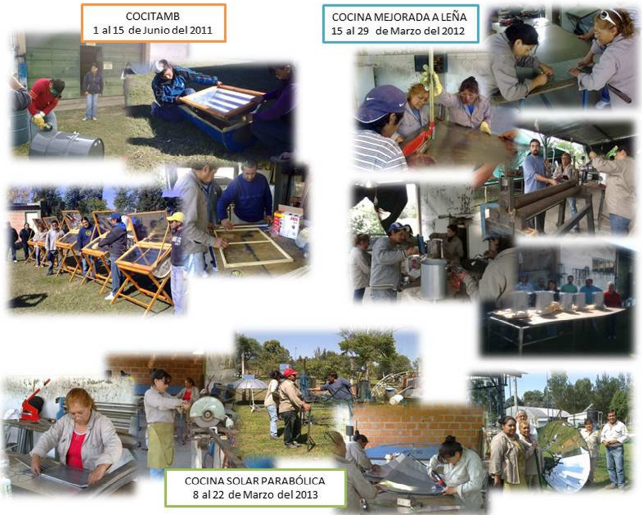
Figura 2: Etapas de implementación y capacitaciones en el INENCO a cooperativa 26 de Agosto