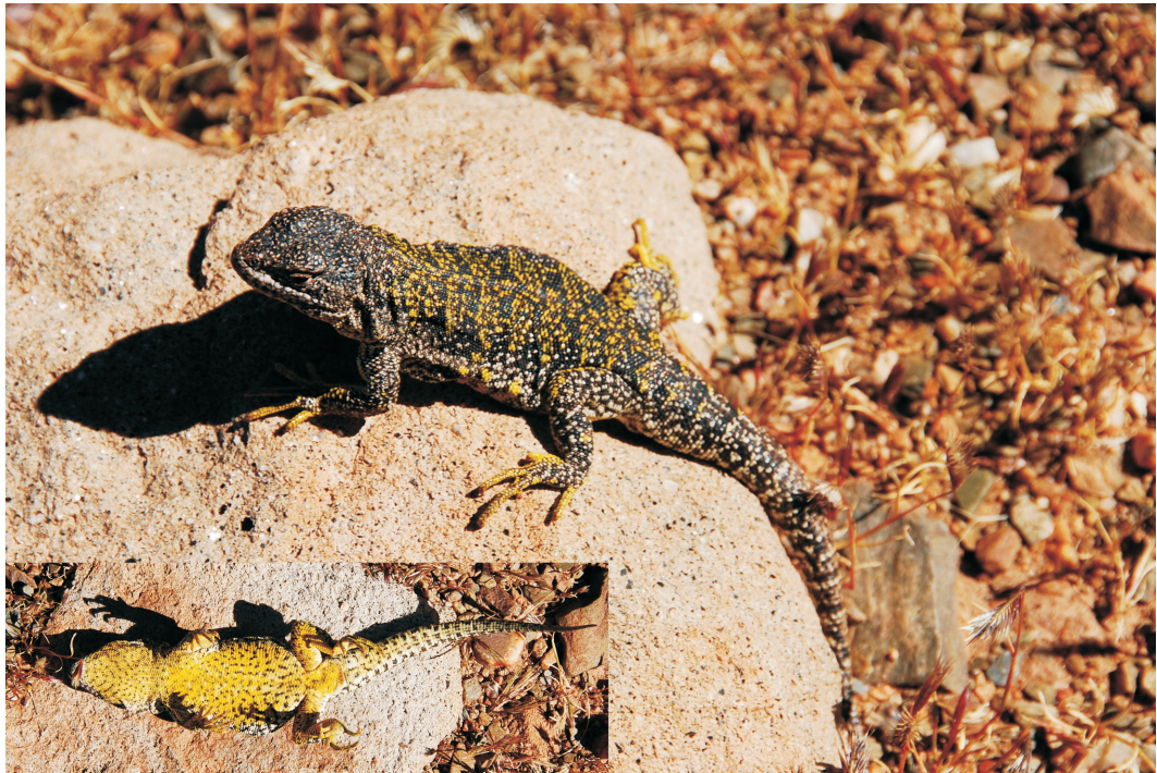
Fig. 1. Vista dorsal y ventral del holotipo de Liolaemus porosus sp. nov. Fig. 1. Dorsal and ventral views of Liolaemus porosus sp. nov. holotype.

Argentina, ubicado en el límite internacional con Chile por el paso Socompa, departamento de Los Andes, provincia de Salta, Argentina. Coordenadas: 24°34'40.2" S y 68°11'58.4" W, 3 707msnm.