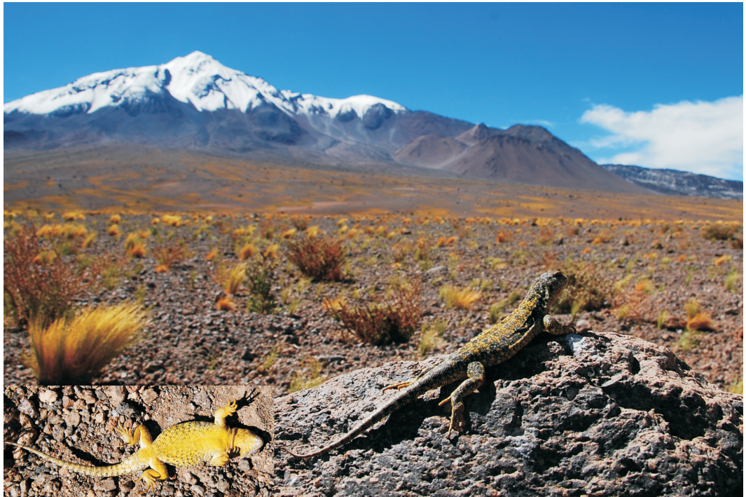
Fig. 2. Vista dorsal y ventral de un macho de Liolaemus porosus sp. nov. Fig. 2. Dorsal and ventral views of a male Liolaemus porosus sp. nov.