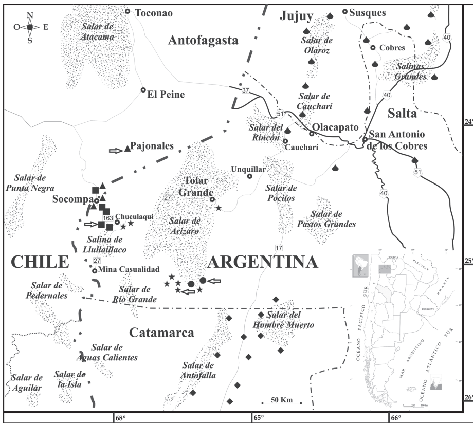
Fig. 5. Area de distribución conocida de Liolaemus porosus sp. nov. y las especies del grupo de L. montanus cercanas geográficamente. Cuadro negro: L. porosus . Triángulo negro: L. nigriceps . Estrella negra: L. cazianae . Círculo negro: L. halonastes . Rombo negro: L. poecilochromus . Lágrima negra: L. multicolor . Las flechas indican la localidad tipo.

Historia natural: Liolaemus porosus habita un área montañosa, muy hostil, por arriba de los 3 600msnm (Fig. 2). En el ambiente