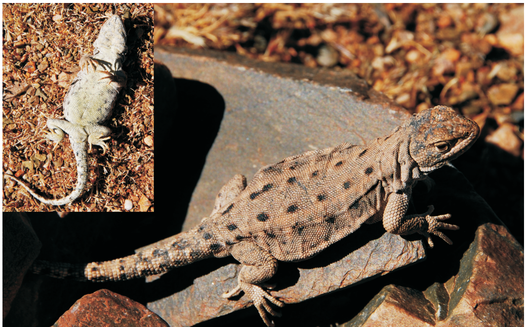
Fig. 3. Vista dorsal y ventral de una hembra de Liolaemus porosus sp. nov. Fig. 3. Dorsal and ventral views of a female Liolaemus porosus sp. nov.