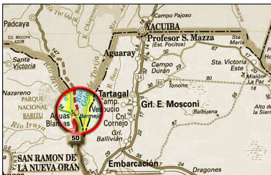
El círculo indica el espacio fronterizo referido– Aguas Blanca / Bermejo

En las proximidades de Aguas Blancas, por la actividad económica del departamento, existen parajes donde viven los trabajadores de fincas y de extracción de madera. Estas familias trabajan de forma informal, muchas están conformadas por ciudadanos bolivianos y argentinos, es una zona de intenso tránsito e importante densidad de habitantes. Tal es así que en los parajes de Abra Grande, Candado, Peña Colorada, Río Pescado, se han establecido escuelas primarias para atender la demanda educativa de nivel primario.