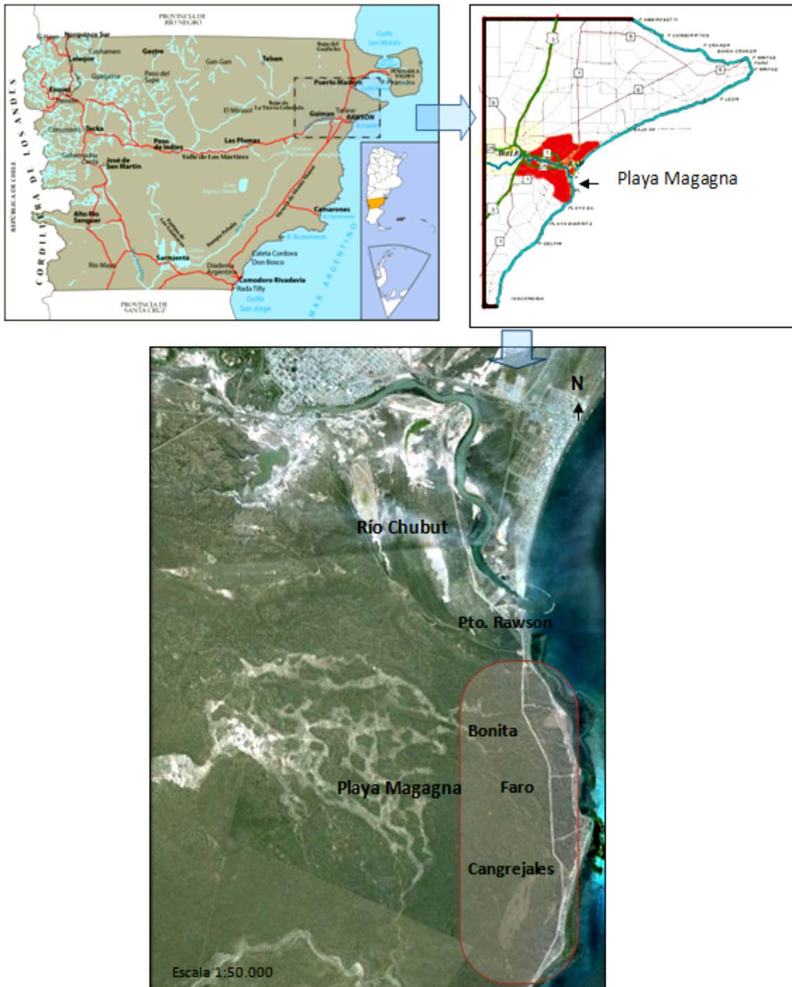
Figura 1. Localización de Playa Magagna (Chubut, Argentina)