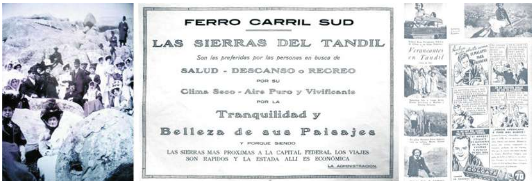
Imagen 5: Composición en la que se observan veraneantes tandilenses de principios del siglo XX (circa 1900), junto a la promoción del ferrocarril como medio destacado de acceso turístico (1923) y el renovado espectro social veraneante cerca de mediados del mismo siglo (1939).