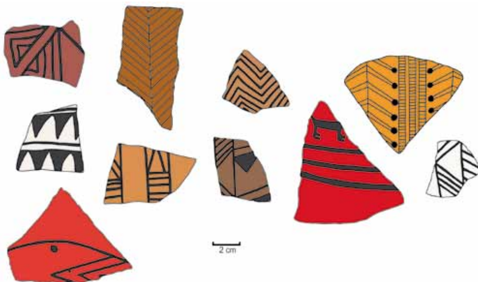
Figura 3. Fragmentos representativos del estilo Inka provincial de El Shincal (zona de descarte).

Uno de los primeros datos que resalta de estos guarismos es el porcentaje relativo de cerámica de tipo Inka provincial. Se trata de fragmentos que representan muy bien aquella simbología inka, volcados en los clásicos íconos de triángulos en hilera, clepsidras, helechos, chevrones, rombos, muchos, en general, trazados en líneas finas de color negro, aunque más raramente en rojo (Figuras 3 y 4). También abundan los engobes rojos, blancos o ante con un muy buen acabado de pulido en su superficie. En relación con la pasta tenemos uno de los mejores elementos para pensar en su