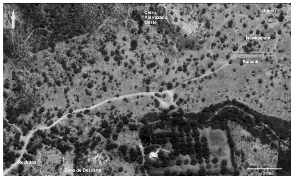
Figura 2. Ubicación de la zona de descarte (punteado) en relación con otras estructuras del sitio.

Este espacio no presenta construcción alguna sobre su superficie pero, en cambio, ha exhibido una inusual concentración de fragmentos cerámicos. Sólo por poner un ejemplo, mencionamos que hemos realizado recolecciones superficiales en otros sectores