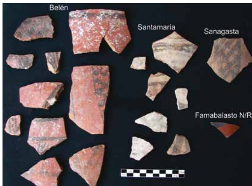
Figura 5. Conjunto de fragmentos pertenecientes a diferentes estilos propios del NOA.

p'uku más (seis o siete) pero quedan opacados por la presencia mayoritaria de urnas.