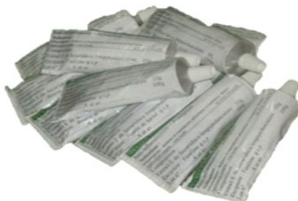
Figure 4 : Présentation des pommades SECUDOL 10%, 15%, 20% à beurre de karité.

Au total, 21 tubes de pommades aux différentes concentrations ont été obtenus. La dénomination retenue est Pommade SECUDOL 10%, 15% et 20% (Figure 4).