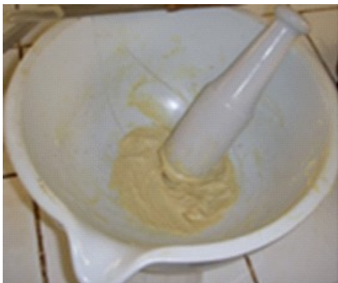
Figure 2 : Pommade à base de l'extrait hydroéthanolique des écorces de racines et du beurre de karité.

Des pommades à différentes concentrations ont été préparées en utilisant la technique décrite dans les travaux de Yapi et al. (2019). La préparation a été faite manuellement : les quantités d'extrait lyophilisé correspondant aux concentrations 10%, 15% et 20% ont été triturées jusqu'à homogénéité totale avec un pilon dans un mortier en porcelaine avec les quantités nécessaires de beurre de karité (Figure 2).