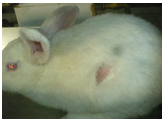
Figure 7 : Lapin sans aucune réaction cutanée (partie circonscrite) sur son flanc.

La figure 7 présente le flanc d'un lapin blanc albinos après 72 heures de l'application de la pommade SECUDOL 20%.