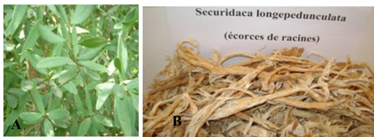
Figure 1 : Securidaca longepedunculata Fresen avec A : Branches feuillées, B : Ecorces de racines séchées au DMT constituant le matériel végétal dans la présente étude

Il est constitué par les écorces de racines de Securidaca longepedunculata (Figure 1). La plante a été identifiée dans le lieu de récolte par Mr Seydou M. Dembélé, Responsable de la section botanique du Département Médecine Traditionnelle (DMT) de Bamako en référence à l'herbier n°0247/DMT. L'échantillon a été récolté en mars 2010 à Blendio dans la région sud du pays ( 11^{\circ} 37' 26'' nord, 6^{\circ} 20' 34'' ouest). Il a été séché à l'ombre dans une salle bien aérée et ventilée du DMT puis pulvérisé à l'aide d'un moulin broyeur tamiseur « forplex » de type F1 et tamisé (tamis de diamètre 1,32 mm). La poudre grossière obtenue, a servi pour les différentes analyses et la préparation de l'extrait utilisé comme principe actif pour la formulation des pommades.