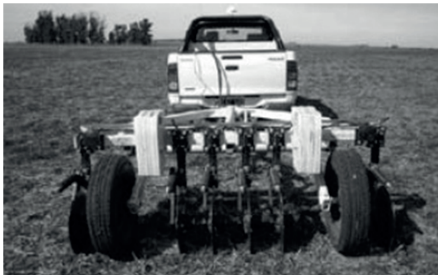
Figura 2. Vista trasera del veris 3100 para las determinaciones de CE_a en posición de trabajo.

El muestreo se realizó con el muestreador a una profundidad de 30 cm guiado a dichos puntos manualmente con un GPS Juno (Trimble Navigation Limited, USA). Las muestras de suelo fueron secadas en estufa a 60 °C con circulación forzada de aire por un tiempo de 10 a 16 horas, dependiendo de la humedad de la muestra. Se molieron y tamizaron por una malla de 2mm. Posteriormente, se determinó la distribución del tamaño de partículas por el método de Bouyoucos (Dewis &